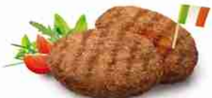
MEDAGLIONE DI CHIANINA IGP F -18°C, 200 g x 20 pz MEDAGLIA DI CHIANINA IGP F -18°C, 110 g x 50 pz