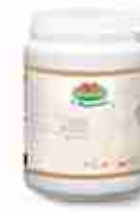
VIANDER ROUX BIANCO GRANULARE A, barattolo 600 g