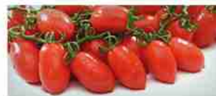
POMODORINI DATTERINI A, latta 6 pz x 1 Kg