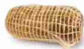
PROSCIUTTO DI CINGHIALE DISSOSSATO SOTTOVUOTO C +0/4°C, 2 Kg c.ca