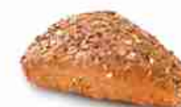
PANINO KUTSHER Panino triangolare, dal gusto unico ottenuto da farine diverse e una particolare guarnizione di semi vari. Ottimo da farcire. F -18°C, conf. 40 pz 80 g cad.