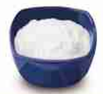
ZUCCHERO A VELO A, busta 5 Kg