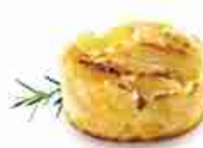
GRATIN DI PATATE F -18°C, 20 pz x 90 g