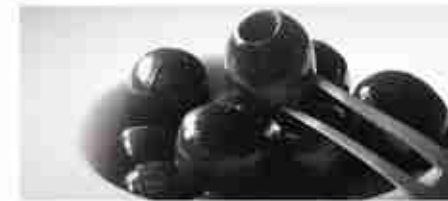
OLIVE NERE DENOCCIOLATE A, busta 1 Kg