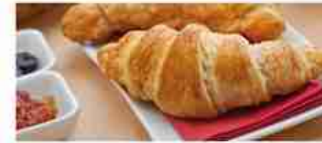
CORNETTI IMBUSTATI Albicocca o Cacao A, conf. 6 pz x 12 buste