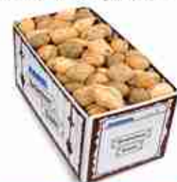
MINI PANINI MISTI Panini da 40 g l'uno in 5 varietà: Olive, Semi di girasole, Malto e semi, Ricotta e semi, Cipolla. Ideale per i vostri buffet F -18°C, conf. 175 pz