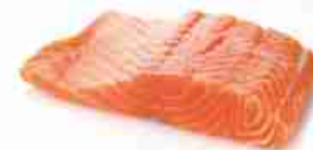
SALMONE NORVEGESE AFFUMICATO C +0/4°C, bafra preaffettata 1 Kg c.ca