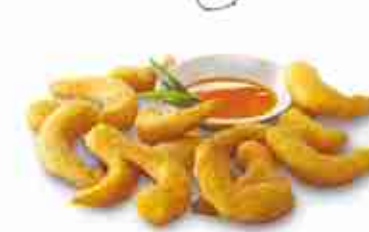
GAMBERI SENSATION Code di gambero panate F -18°C