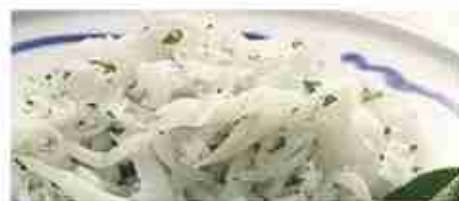
BIANCHETTI F -18°C