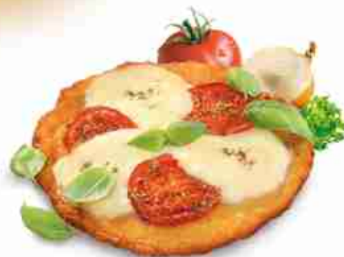
RÖSTI DISCO Schiacciata di patate precotta ø 17 cm F -18°C, conf. 3 Kg

Le patate in versione fantasiosa e particolarmente prelibata.