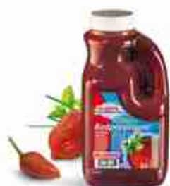
SALOMON REDPEPPAJAM® Salsa rustica dolce/piccante a base di marmellata di peperoni A, conf. 2 Kg