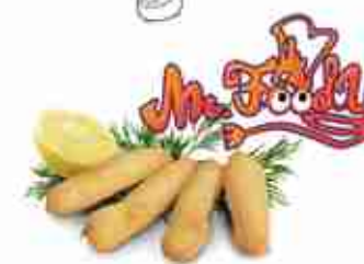
FILETTI DI BACCALÀ Gustoso baccalà pastellato F -18°C, conf. 2,5 Kg