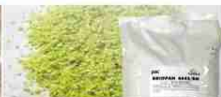
BRIOPAN PANATURA Panatura fine industriale bianca o arancio A, conf. 2 Kg