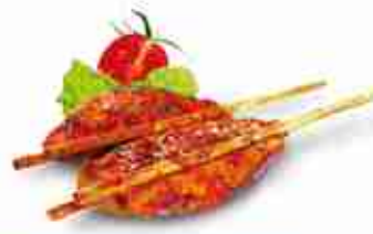
CHIK'N DOUBLE STICK "MEDITERRANEAN" Filetto di pollo precotto e marinato in stile "Med" su due bastoncini di bambù F -18°C, busta 1 Kg