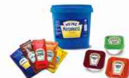
HEINZ SECCHIELLI - DIP - BUSTINE Ketchup secchiello 6 Kg; Maionese 5 Kg; Dip 100 pz; Bustine 200 pz A