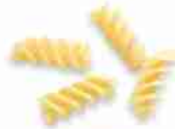
ELICONI A, conf. 500 g