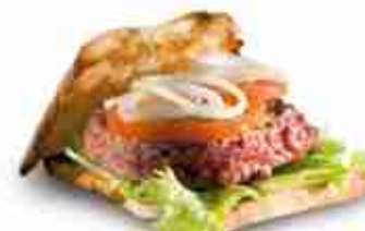
HAMBURGER DI JAMON DE CEBU "PATANEGRA" F -18°C, 200 g x 20 pz