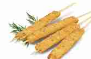
ARROSTICINI DI TOTANO F -18°C, conf. 3 Kg