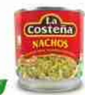
LA COSTEÑA JALAPENO NACHOS Peperoncini jalapeño a fette A, conf. 220 g - 3 / 1 kg