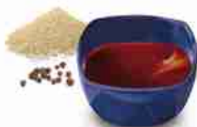
TERIYAKI A base di soia, miele, vino dolce, saké o mirin A, conf. 200 ml