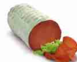
BRESAOLA PUNTA D'ANCA A metà sottovuoto C +0/4°C, conf. 1,5 Kg c.ca