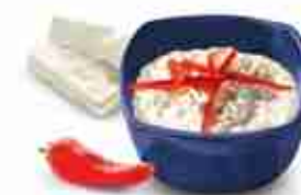
TIROSALATA Salsa a base di formaggio feta e peperoncino piccante C +0/4°C, conf. 2 Kg