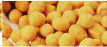
MEFISTO PAPEETE NOCCIOLINE RICOPERTE A, busta 500 g