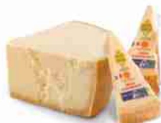
SPICCHI E OTTAVO GRANA PADANO C +0/4°C, spicchio 1 Kg c.ca ottavo 4 Kg c.ca