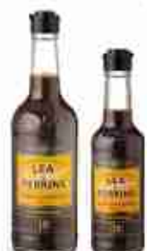
LEA & PERRINS WORCESTER SAUCE A, conf. 150 ml