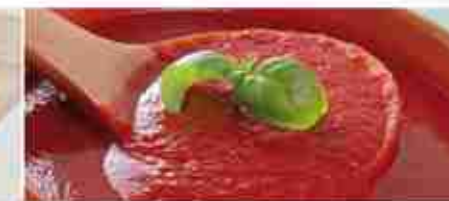
PASSATA DI POMODORO A, latta 6 pz x 3 Kg