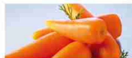
CAROTINE BABY F -18°C