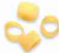
CALAMARATA A, conf. 500 g