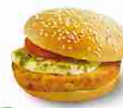
VEGGIE BURGER Con patate, piselli, carote e verdure varie F -18°C, 100 g x buste 2,5 Kg