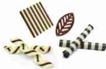
DECORAZIONI DI CIOCCOLATO Assortimento di decorazioni di cioccolato per dolci A