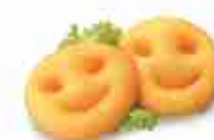
SMILE POTATOES F -18°C, conf. 2,5 Kg