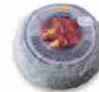
PECORINO SOTTO CENERE C +0/4°C, 1,5 Kg c.ca