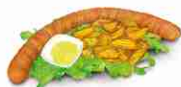
BOCK WÜRST XXL Maxi-würstel da 45 cm, 500 g con paprika dolce e bacon C +0/4°C, conf. 2 pz x 500 g