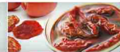
POMODORI SECCHI IN OLIO A, vetro 3,100 Kg