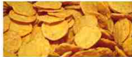
SNACK MEXICO A, busta 500 g