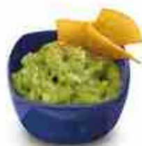
GUACAMOLE FROZEN Salsa a base di avocado F -18°C, conf. 500 g