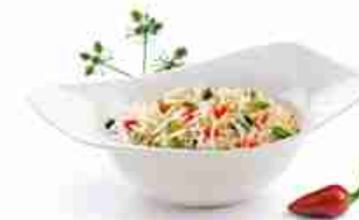
BASMATI Ideale come contorno, per risotti e insalate A, crudo, 12 x 500 g