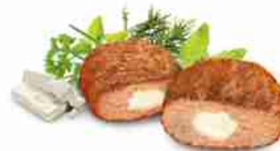
BIFTEKI RUSTICO Hamburger di manzo ripieno di formaggio F -18°C, 160 g x 40 pz