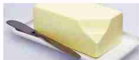
BURRO IN PANETTI C +0/4°C, conf. 1 Kg