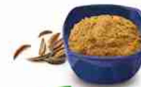
CUMINO IN POLVERE A, conf. 1 Kg