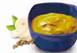
SENAPE La classica A, bustine, squeezer e secchielli