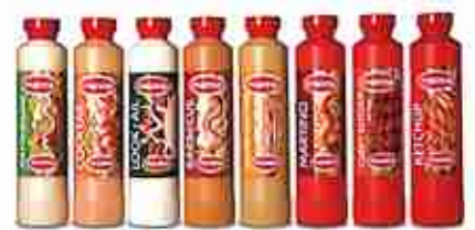
SALSE MANNA Squeezer / Secchielli / Biberon richiedi l'elenco completo A