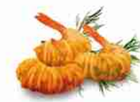
GAMBERI "NOODLES" Croccanti gamberi ricoperti da fili di noodles F -18°C