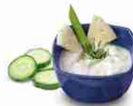
TZATZIKI Salsa a base di yogurt e cetrioli C +0/4°C, conf. 2 Kg