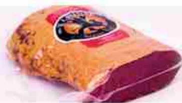
FIOR DI CERVO AL MIELE C +0/4°C, 1,2 Kg c.ca