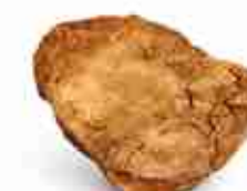
GUANCIALE C +0/4°C, 1 Kg c.ca