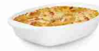
TARTIFLETTE DI PATATE Preparato per terrina di patate con formaggio Reblochon, bacon e cipolla F -18°C, conf. 750 g