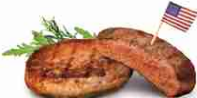
BLACK ANGUS 100% Hamburger di puro manzo americano F -18°C, 110/200 g x 20 pz