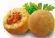
ARANCINO AL SUGO MIGNON F -18°C, buste 2,5 Kg