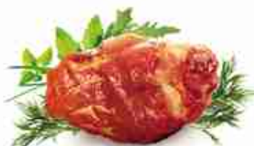
STINCO DI MAIALE ALLA BIRRA C +0/4°C, pezzatura da 800 g / 1 Kg c.ca