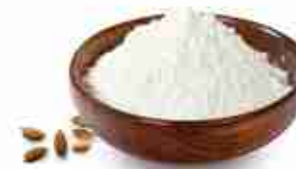
AMIDO DI RISO A, busta 1 Kg