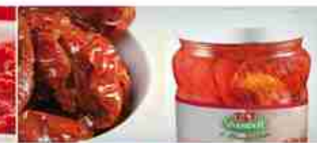
VIANDER POMODORINI SEMI-SECCHI A, 800 g