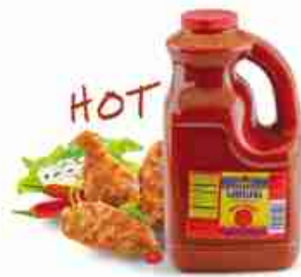
LOUISIANA SAUCE Salsa piccante e speziata ideale per "Buffalo Wings" A, conf. 3,75 Lt