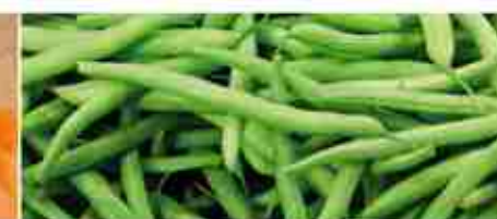
FAGIOLINI F -18°C