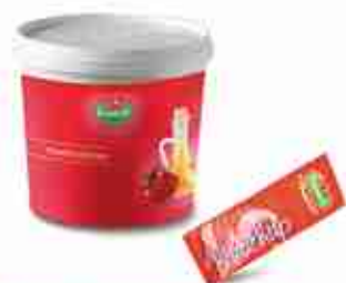
VIANDER KETCHUP SECCHIELLO E BUSTINE A, secchiello 5 Kg; bustine 250 pz