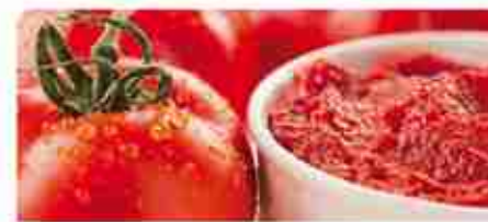
DOPPIO CONCENTRATO DI POMODORO A, latta 12 pz x 1 Kg / 12 pz x 3 Kg