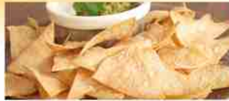
TORTILLAS CHIPS SALATE O PICCANTI A, busta 500 g