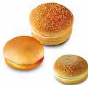
PANINI PER HAMBURGER DOUBLE BURGER CON SESAMO 24 pz x 84 g CON SESAMO 126 g x 16 pz / 83 g x 24 pz 56 g x 48 pz SENZA SESAMO 100 g x 40 pz / 84 g x ...24 pz MINI PANINI 22 g x 180 pz