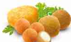
FRITTO MISTO NAPOLI F -18°C, buste 2,5 Kg