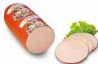
FLEISCHWÜRST Metà sottovuoto C -0/4°C, conf. 3 Kg c.ca