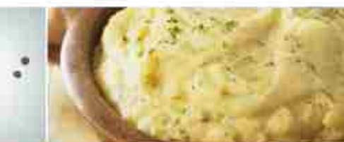
PREPARATO PER PURÈ DI PATATE A, conf. 1 Kg