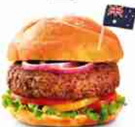
AUSTRALIAN BLACK ANGUS Hamburger di manzo australiano F -18°C, 150 g x 20 pz