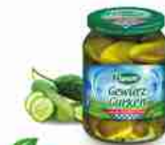
GEWÜRZGURKEN SPECHT Cetrioli a fette in agrodolce A, conf. 1,5 Kg Cetrioli interi in agrodolce A, conf. 1,5 Kg