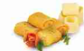
PACCHERI CHEF Ripieno di ricotta, mozzarella e pomodoro F -18°C, buste 1 Kg