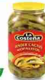
LA COSTEÑA NOPALITOS TENDER CACTUS Listelli di cactus ricchi di fibre, vitamine e sali minerali A, vetro 825 g