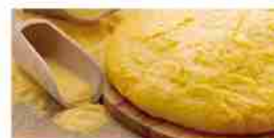
POLENTA ISTANTANEA A, conf. 500 g