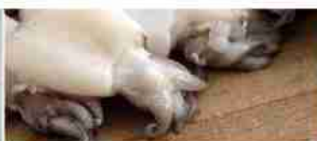
SEPIE SVUOTATE O INTERE F -18°C