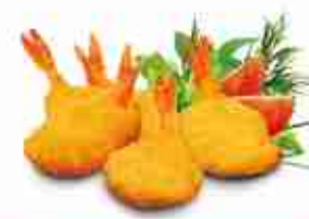
GAMBERI BUTTERFLY Croccanti gamberi panati F -18°C, conf. 1 Kg