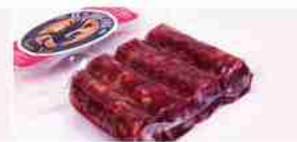
SALSICCIA DI CINGHIALE C +0/4°C, 1500 g c.ca