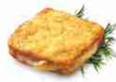
RÖSTI TOAST Toast di patate con prosciutto e formaggio F -18°C, conf. 200 g cad.