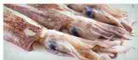
CALAMARI F -18°C