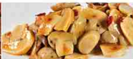
FUNGHI CHAMPIGNON TAGLIATI ALLA CONTADINA A, vetro 3,100 Kg TRIFOLATI A, busta 1,700 Kg NATURALE A, latta 3 Kg