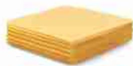
CHEDDAR SLICE Formaggio Cheddar a fette C +0/4°C, conf. 2,5 Kg