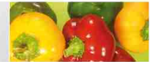
PAPACELLE IN ACETO C +0/4°C, secchiello 1 Kg