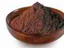
CACAO AMARO Cacao amaro in polvere per guarnizioni dolci e dessert A, 1 Kg