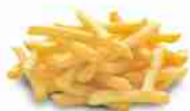
MYDIBEL PREMIUM Premium 7/7 e Premium Crunchy 7/7: inamidate dal gusto extra-croccante F -18°C, conf. 2,5 Kg