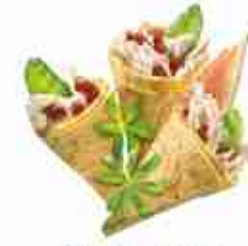
MINI WRAP AFRICAN CHIK'N Mini tortillas ripiene di pollo, taccole, mais e salsa piccante F -18°C, buste 1,190 Kg