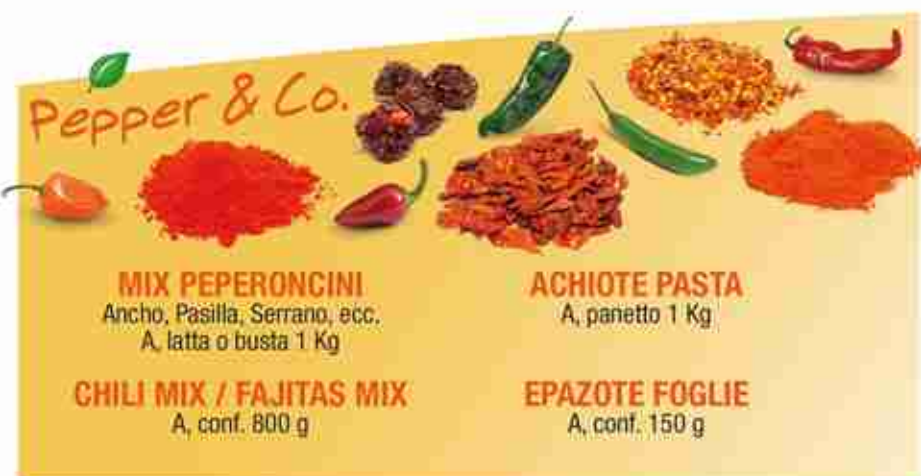
MIX PEPERONCINI Ancho, Pasilla, Serrano, ecc. A, latta o busta 1 Kg