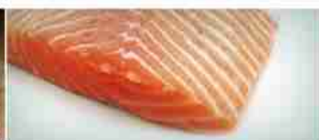
TRANCE DI SALMONE F -18°C