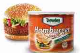
DEVELEY HAMBURGER SAUCE Salsa rustica con leggero gusto di manzo affumicato A, conf. 2 Kg