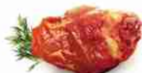
STINCO DI MAIALE Alla birra con cotenna C +0/4°C, 800 g / 1 Kg Classico in alluminio C +0/4°C, 600 g c.ca