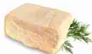
PECORINO DI FOSSA C +0/4°C, 1,200 Kg c.ca