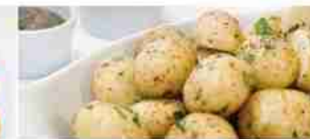
PATATE NOVELLE A, vetro 680 g / latta 3 Kg