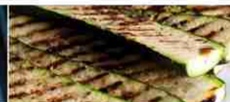
ZUCCHINE GRIGLIATE F -18°C