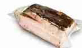
LARDO AROMATICO PATANEGRA C +0/4°C, 1,5 Kg