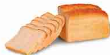
PANE IN CASSETTA PER SANDWICH F -18°C, 8 pz di pane x cart. 750 g cad. 22 fette x 35 g