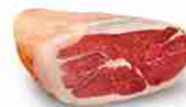
PROSCIUTTO CRUDO SENZA OSSO MEC C +0/4°C, 6/7 Kg