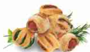
RUSTICI MIGNON ASSORTITI F -18°C, buste 2,5 Kg