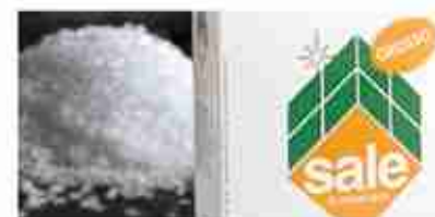
SALE GROSSO 1 KG A, conf. 1 Kg