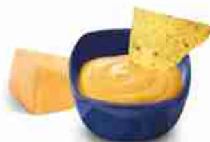
SALSA CHEDDAR Gusto deciso grazie al formaggio Cheddar A, conf. 2,7 Kg