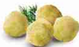
ZEPPOLINE DI ALGHE F -18°C, buste 2,5 Kg