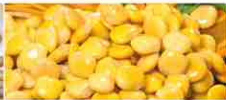
LUPINI A, secchiello 1 Kg / 5 Kg