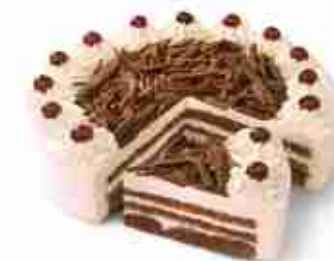
FORESTA NERA Pan di spagna al cioccolato con panna montata e ciliegie F -18°C, torta pretagliata 2 Kg x 16 porzioni