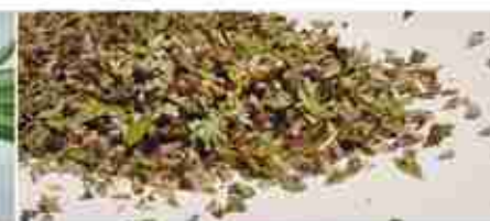
ORIGANO SECCO A, buste 1 Kg