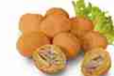
OLIVE ALL'ASCOLANA F -18°C, buste 2,5 Kg