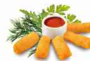
CROCCHETTE DI GAMBERO F -18°C, conf. da 750 g