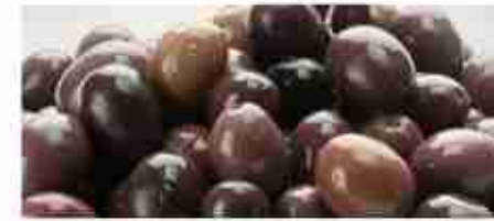
OLIVE NERE TIPO GAETA C +0/4°C, secchiello 1/5 Kg