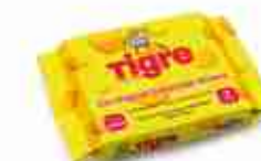
SOTTILETTE TIGRE C +0/4°C