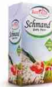
PANNA ACIDA Panna al 24% pastorizzata C +0/4°C, brik 1 Lt