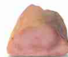
TRANCIO DI PESCE SPADA C +0/4°C, 2 Kg c.ca