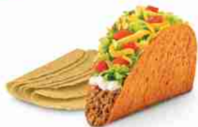
TACO SHELL A, 20 pz x 10 buste