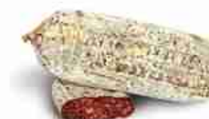
SPIANATA DI CINGHIALE C +0/4°C, 1,5 Kg