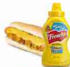
FRENCH'S CLASSIC YELLOW MUSTARD Classica dal gusto intenso e inimitabile A, conf. 266 g