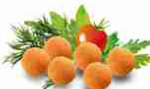
MOZZARELLINE PANATE F -18°C, buste 2,5 Kg