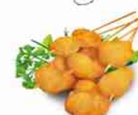
MR. GAMBOLI Spiedino panato di gambero e oliva F -18°C, conf. 1 Kg