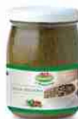
SALSA RUCOLINA A, vetro 580 g