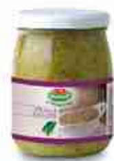
CREMA DI ZUCCHINE A, vetro 580 g