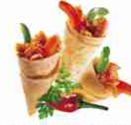
MINI WRAP BBQ CHIK'N Mini tortillas ripiene di pollo marinato peperone e salsa BBQ F -18°C, buste 1,190 Kg