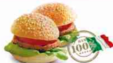
MEDAGLIETTE DI CHIANINA IGP F -18°C, 30 g x 100 pz