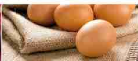
UOVA C +0,4°C, fomato L 90 pz / 180 pz