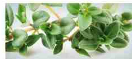
TIMO A, formato Pet