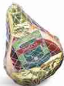
PROSCIUTTO DI NORCIA SENZA OSSO C +0/4°C, 5/6 Kg c.ca