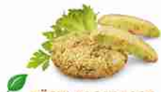
RÖSTI CASARECCE Cotolette vegetali impanate e precotte F -18°C, conf. 3 Kg