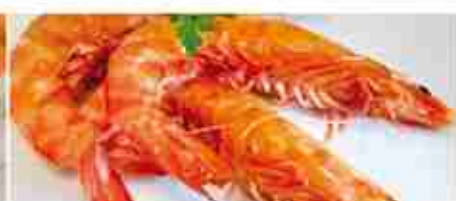
MAZZANCOLLE F -18°C