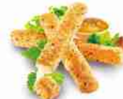
PRIMO MOZZARELLA Sticks di vera mozzarella, burro e spezie in una dorata e croccante panatura F -18°C, busta 1 Kg