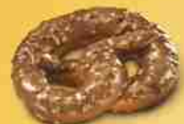
BRETZEL CIOK Cod. 1766 ricoperto di cioccolato 72 g F -18°C, 36 pz x 2,6 Kg c.ca