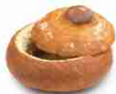
TERRINA DI PANE Terrina di pane bruno ø 13 cm F -18°C, 165 g x 30 pz