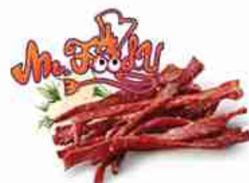
MR.FOODY COPPIETTE DI MAIALE Straccetti di carne secca con paprika e peperoncini C +0/4°C, 1 Kg c.ca