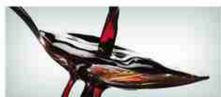
ACETO BALSAMICO A, conf. 250 ml / 500 ml / 2 Lt