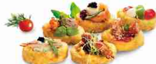
RÖSTI MINI BARCHETTE Barchette di patate guarnibili F -18°C, conf. 2,5 kg