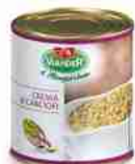
CREMA DI CARCIOFI A, latta 1 Kg