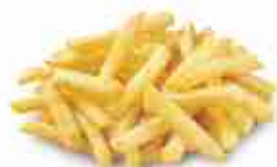
MYDIBEL CLASSICHE 9/9 F -18°C, conf. 2,5 Kg