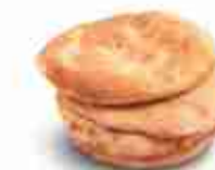
PANE PER KEBAB F -18°C, conf. 10 buste x 3 pz