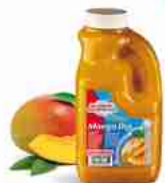
SALOMON MANGO DIP Salsa dall'intenso gusto fruttato, ideale su pollo, carne, pesce, formaggi A, conf. 2,350 Kg