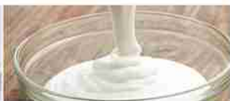
PANNA DA CUCINA A, conf. 500 g