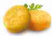
FRITTATINE DI SPAGHETTI MIGNON F -18°C, buste 2,5 Kg