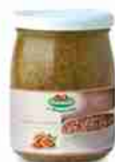
CREMA DI NOCI A, vetro 580 g