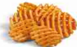
PATATE CRISS CUT F -18°C, conf. 2,5 Kg