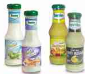
DEVELEY DRESSING CAESAR a base di formaggio YOGURT a base di yogurt bianco A, conf. 500 ml HONEY MUSTARD INDIANA a base di curry e frutta A, conf. 250 ml