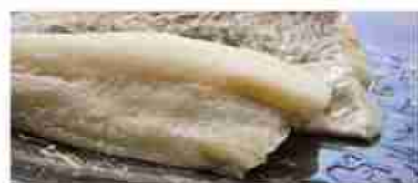
FILETTO DI BACCALÀ 500/1000 F -18°C