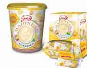
GAIA MAIONESE SECCHIELLO E BUSTINE A, secchiello 5 Kg; bustine 102 pz