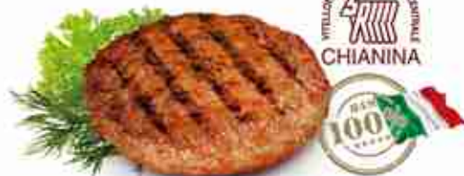
GAGLIARDO DI CHIANINA IGP Hamburger di chianina 100% manzo italiano F -18°C, 380 g x 20 pz