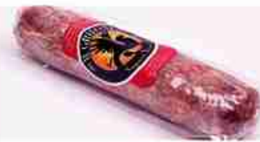
SALAME DI CINGHIALE C +0/4°C, 500 g c.ca