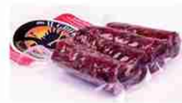
SALSICCIA DI CERVO C +0/4°C, 100 g c.ca