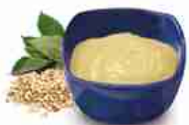
TAHINA 100% Salsa a base di sesamo A, conf. 200 ml