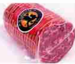
SOPRESSATA DI CINGHIALE C +0/4°C, 1,2 Kg c.ca