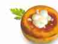
PIZZETTE PRECOTTE F -18°C, buste 2,5 Kg