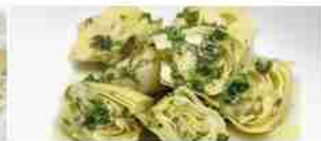
CARCIOFI A SPICCHI A, vetro 3,100 Kg