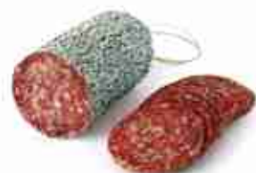
SALAME NAPOLETANO C +0/4°C, 1,5 Kg