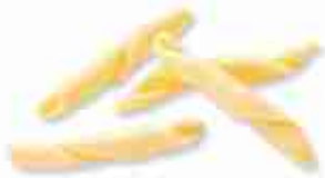
STROZZAPRETI A, conf. 500 g