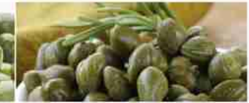
CAPPERI FRUTTI A, vetro 290 g Capperi al sale C +0/4°C, secchiello 1 Kg