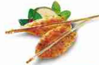
FISH DOUBLE STICK "SWEET CHILI" Filetto di pangasius marinato piccante su due bastoncini di bambù F -18°C, busta 1 Kg