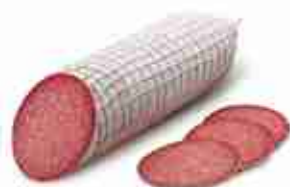
SALAME UNGHERESE C +0/4°C, 3 Kg