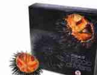
POLPA DI RICCIO DI MARE Polpa di riccio cileno C +0/4°C, 135 g