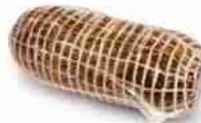
PROSCIUTTO DI CERVO SOTTOVUOTO C +0/4°C, 2 Kg c.ca