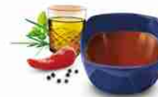
TENNESSEE GLAZE Glassa al bourbon per un gusto inimitabile A, conf. 3,4 Kg