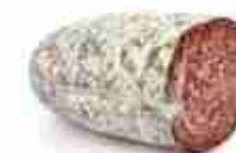
FINOCCHIONA TOSCANA C +0/4°C, 3 Kg c.ca