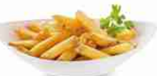
PATATE CON BUCCIA 14/14 F -18°C, conf. 2,5 Kg