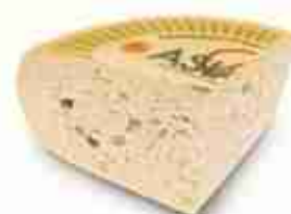
ASIAGO CUBETTATO C +0/4°C, 1 Kg c.ca