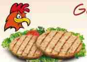
POLLO BURGER Gustoso hamburger di pollo pregrigliato F -18°C, in versione da 80 / 180 g