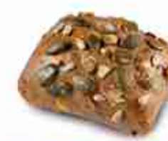
PANINO AI SEMI DI ZUCCA Ciabatta di farina di frumento e segale, guarnita con croccanti semi di zucca. Ideale per la preparazione di panini imbottiti. F -18°C, conf. 100 pz 80 g cad.