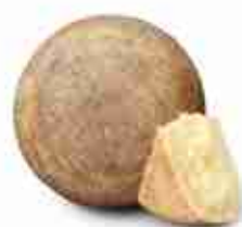
100 GIORNI Formaggio di pecora affinato C +0/4°C, 6 Kg c.ca