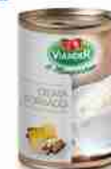
CREMA DI FORMAGGI A, latta 1 Kg