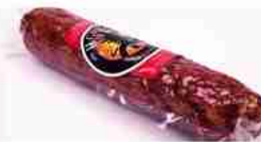
SALAME D'OCA C +0/4°C, 500 g c.ca