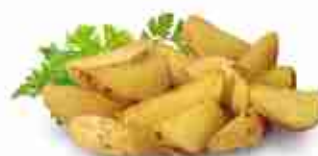
PATATE SKIN Patate a spicchi con buccia F -18°C, conf. 2,5 Kg