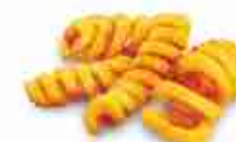
PATATE TWISTER F -18°C, conf. 2,5 Kg