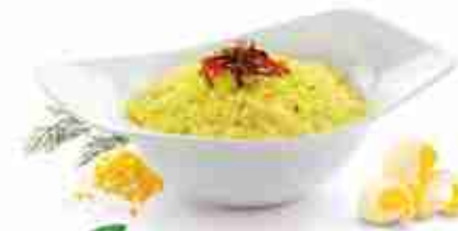
RISO PILAF Riso cotto aromatizzato alla curcuma F - 18°C, precotto 200 g