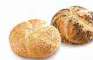
ROSETTA AL SESAMO O AL PAPAVERO Rosetta di farina di frumento ben cotta, guarnita con semi di sesamo o papavero. F -18°C, conf. 40 pz 60 g cad.