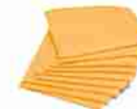
SOTTILETTE CHEDDAR C +0/4°C, conf. 2,5 Kg