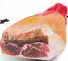
PARMA O SAN DANIELE SENZA OSSO Prosciutto crudo intero senza osso C +0/4°C, 7/8 Kg c.ca