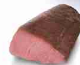
TRANCIO DI TONNO C +0/4°C, 2 Kg c.ca