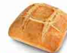
PANINO CROCCANTE Panino quadrato di farina di frumento, con soffice mollica e croccante crosta dorata. F -18°C, conf. 40 pz 88 g cad.