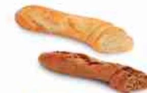
BAGUETTINO E BAGUETTINO FINLANDESE Cod. 944 / 906 F -18°C, conf. 40 pz 88 g cad.