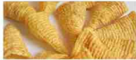
BUGLES CONETTI DI MAIS A, busta 500 g