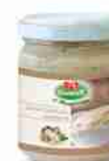
SALSA TARTUFO BIANCHETTO A, vetro 580 g