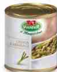
CREMA DI ASPARAGI A, latta 1 Kg