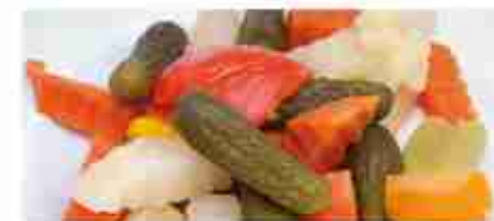
GIARDINIERA IN ACETO C +0/4°C, secchiello 1 Kg