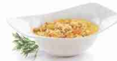
RIBE Riso ideale per risotti e minestre A, crudo, 12 x 500 g