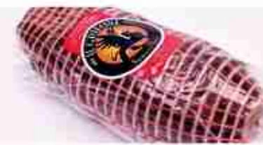
PROSCIUTTO DI DAINO C +0/4°C, 500 g/1,5 Kg c.ca