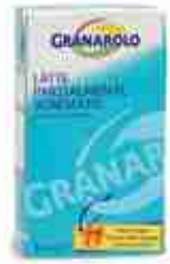
LATTE UHT Latte parzialmente scremato a lunga conservazione A, 1 Lt. x 12 pz