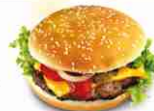
RANCH MASTER Hamburger di manzo scelto F -18°C, nei formati: 63 / 100 / 125 / 150 g