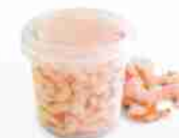
GAMBERI IN SALAMOIA MARI CALDI C +0/4°C, conf. 1 Kg