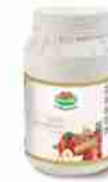
VIANDER BRODO DI CARNE A, barattolo 1,5 Kg