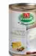
CREMA DI FORMAGGI C +0/4°C, conf. 800 g