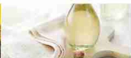
ACETO BIANCO A, conf. 250 ml / 1 Lt