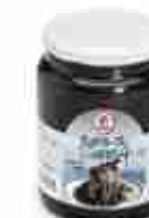
NERO DI SEPIA C +0/4°C, vetro 500 g