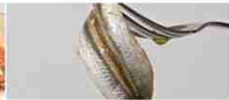
ACCIUGHE A, vetro 1,700 Kg