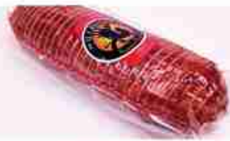
PROSCIUTTO DI CERVO C +0/4°C, 700 g c.ca