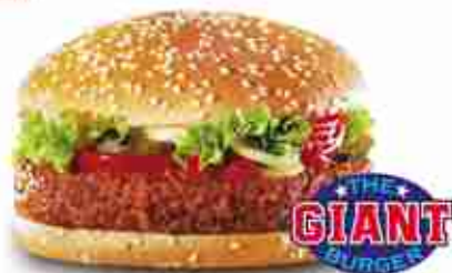
THE GIANT XXL Hamburger di manzo scelto F -18°C, nei formati: L = 180 g / XL = 226 g / XXL = 339 g