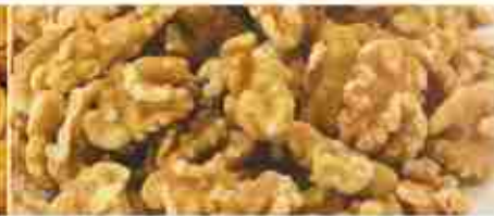
GHERIGLI DI NOCI A, busta 1 Kg