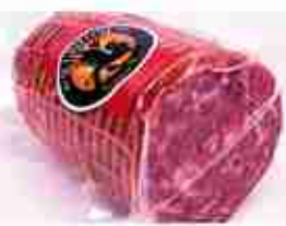
SOPRESSATA D'OCA C +0/4°C, 1,2 Kg c.ca