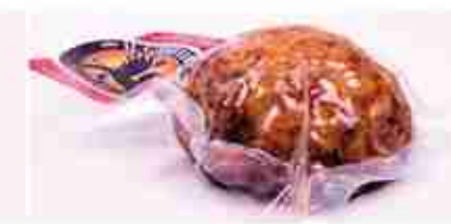
PITINA DI CERVO/CINGHIALE C +0/4°C, 200 g c.ca