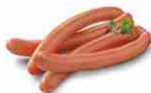
DEUTSCHLÄNDER WÜRST A, vetro 6 pz 330 g