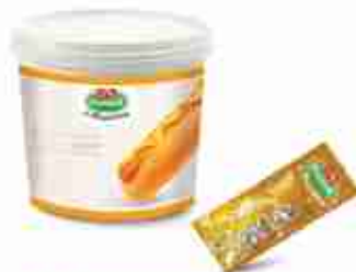
VIANDER SENAPE SECCHIELLO E BUSTINE A, secchiello 5 Kg; bustine 250 pz