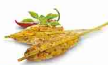
CHIK'N DOUBLE STICK "SWEET CHILI" Filetto interno di pollo marinato dolce-piccante su due bastoncini di bambù F -18°C, busta 1 Kg