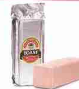
SPALLA COTTA C +0/4°C, 4 Kg c.ca