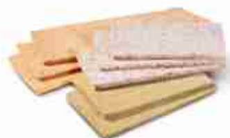
MIX PANE PER TRAMEZZINI 6 conf. 980 g (2 x tipo, verde, rosso e integrale) F -18°C, 165 g x 30 pz