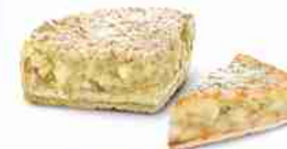
TORTA DI MELE PREMIUM Classica torta di mele con mandorle in scaglie che ne esaltano il sapore F -18°C, torta pretagliata 2,5 Kg x 12 porzioni