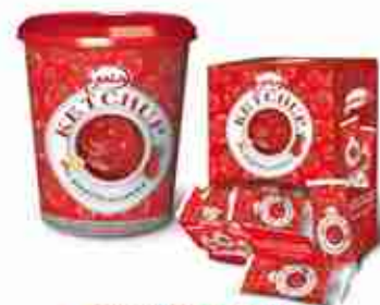
GAIA KETCHUP SECCHIELLO E BUSTINE A, secchiello 5 Kg; bustine 102 pz