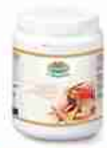
VIANDER FUMETTO DI PESCE/CROSTACEI A, barattolo 600 g