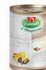
CREMA AI FORMAGGI TARTUFATA A, latta 500 g