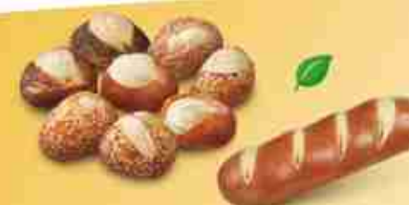
CONFETTI LAUGEN Assortimento di mini laugen F -18°C, 150 pz x 35 g