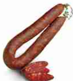
SALAME CHORIZO C +0/4°C, 900 Kg