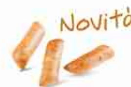
Novità DIPSTICK Bastoncini di pane ottenuti dallo stesso impasto del pane ciabatta, ingredienti 100% naturali, senza agenti lievitanti o additivi. F -18°C, conf. 160 pz 20 g cad.