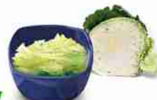
CRAUTI BIANCHI Crauti Classici A, lattina 1 Kg Crauti al Prosecco A, vetro 370 ml