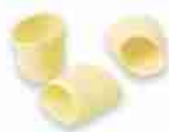
MEZZI PACCHERI A, conf. 500 g