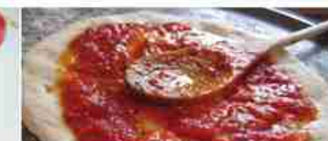
POLPA FINE PER LA PIZZA A, latta 5 / 10 Kg bag 5 Kg