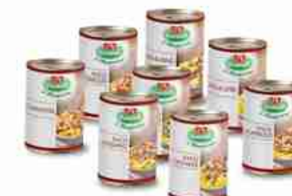
I RAGÙ VIANDER Cinghiale; Cervo; Fagiano; Capriolo; Lepre; Anatra; Coniglio; Asino A, latta 500 g