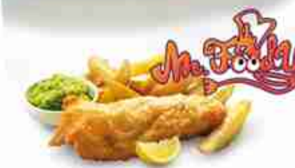
FILETTO DI MERLUZZO Filetto di merluzzo per "Fish & Chips" F -18°C, 140 g pz