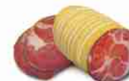
CAPICOLLO DOLCE SOTTOVUOTO C +0/4°C, 1 Kg c.ca