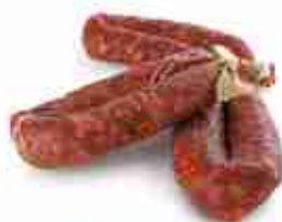
SALAME PICCANTE C +0/4°C, 900 Kg