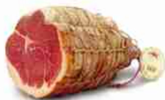
CULATELLO C +0/4°C, conf. 3 Kg c.ca