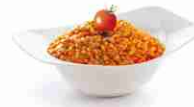
ARBORIO Dal chicco più grande e perlato, riso ideale per risotti e al sugo A, crudo, 12 x 1 Kg