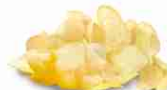
MAXI CHIPS F -18°C, conf. 2,5 Kg