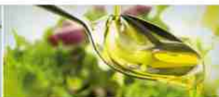
OLIO EXTRAVERGINE DI OLIVA A, conf. 250 ml / 1 Lt / 5 Lt