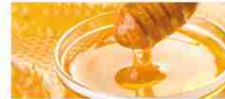
MONODOSI Marmellate: 25 g x 168 pz; Miele: 20 g x 168 pz; Crema Nocciolo: 18 g x 128 pz A