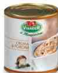
CREMA DI PORCINI A, latta 1 Kg