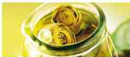
CARCIOFINI GRIGLIATI INTERI A, vetro 3,100 Kg SPACCATI A, latta 800 g