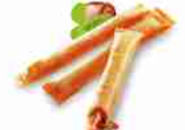
ASIA CIGAR CHINA CHIK'N Croccanti sigari di pasta ripieni di pollo, verdura e spezie asiatiche F -18°C, busta 1 Kg