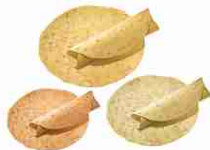
TORTILLAS Vari colori e diametri 15/25/30, le 30 sono classiche, rosse e verdi Tortillas di mais ø 15 cm F -18°C, 18 buste x 24 pz