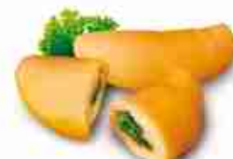
PANZEROTTINI Ripieni di salsiccia e friarielli F -18°C, buste 2,5 Kg