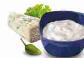
BLUE CHEESE DRESSING Salsa saporita, a base di Gorgonzola A, conf. 3,78 Lt