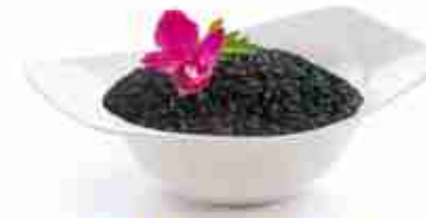
GALLO NERO VENERE Riso ideale come contorno, nelle insalate e per risotti A, crudo, 12 x 500 Kg