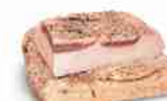
LARDO AROMATICO C +0/4°C, 1,5 Kg