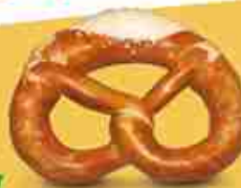
BRETZEL CLASSIC Cod. 1899 - pronto con sale F -18°C, 60 pz x 2 Kg Cod. 145 - pronto grande F -18°C, 16 pz x 2 Kg