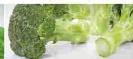
BROCCOLI F -18°C