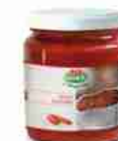
VIANDER 'NDUJA IN VASETTO A, 300 g