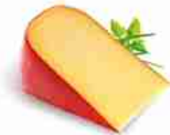
EDAMER C +0/4°C, blocco 3 Kg c.ca