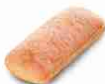
CIABATTA TAGLIATA PRECOTTA F -18°C, 115 g x 60 pz