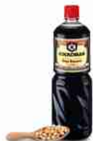
KIKKOMAN SOIA Salsa di soia classica A, vari formati