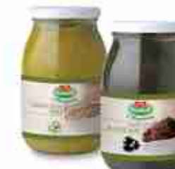
PATÈ DI OLIVE NERE O VERDI A, vetro 950 g