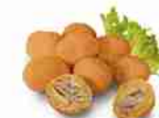
OLIVE ALL'ASCOLANA F -18°C, buste 2,5 Kg