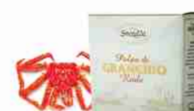
POLPA DI GRANCHIO REALE Polpa di granchio reale della Kamchatka C +0/4°C, lattina 140 g