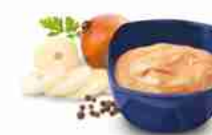
THOUSAND ISLAND Salsa dressing dal sapore stuzzicante A, conf. 3,78 Lt