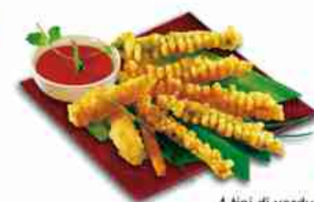
TEMPURA STICKS 4 tipi di verdure ricoperte di pasta sottile e croccante: Long Bean: fagiolini e sesamo / F -18°C, 100 pz x 1 kg c.ca Babycorn: baby-mais e sesamo / F -18°C, 50 pz x 1 kg c.ca Asparagus: asparago verde / F -18°C, 100 pz x 1 kg c.ca Carrot: carota e sesamo / F -18°C, 50 pz x 1 kg c.ca