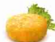
FRITTATINA DI PASTA F -18°C, 130 g buste 2,5 kg