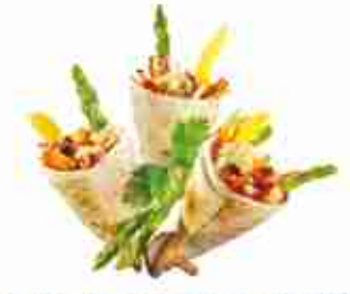
MINI WRAP "ASIAN VEGGIE" Mini tortillas con verdure: asparagi, peperoni, castagne d'acqua, spaghetti di riso, carote, baby mais e salsa alla soia F -18°C, buste 1,190 Kg