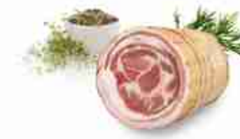
PANCETTA COPPATA INTERA C +0/4°C, conf. 4,5 Kg c.ca