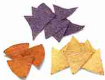
TOTOPOS CRUDI Mini-tortillas triangolare vari gusti: blu, rosse, classiche F -18°C, conf. 5 Kg