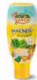
GAIA MAIONESE A, conf. 820 ml