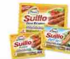
FIORUCCI WÜRSTEL GRANDI E PICCOLI C +0/4°C, conf. 100/250 g