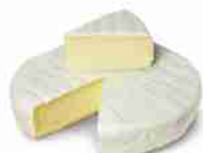
FORMAGGIO BRIE C +0/4°C, 1 Kg c.ca