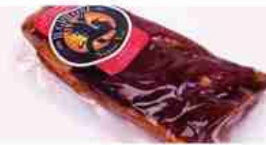
SPECK D'OCA AFFUMICATO C +0/4°C, 600 g c.ca