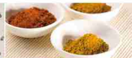
ASSORTIMENTO DI CURRY A, formato Pet