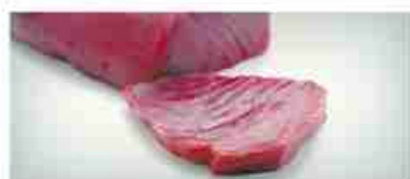
BISTECHE DI TONNO F -18°C