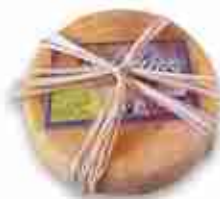
PECORINO SALVATICO C +0/4°C, conf. 400 g