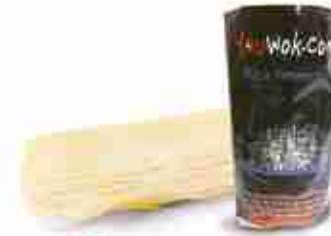
SPAGHETTI DI RISO A, conf. 250 g