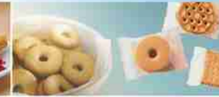
BISCOTTI MONODOSE Rotelle; Frollini; Petit A, conf. 320 pz x 15 g