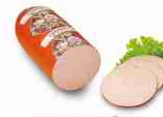
FLEISCHWÜRST Metà sottovuoto C +0/4°C, conf. 3 Kg c.ca