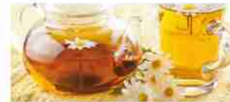
THE O CAMOMILLA IN FILTRI A, conf. 100 filtri