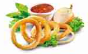
ONION RINGS "BEER BATTERED" Anelli di cipolla pastellati con un 9% di birra F -18°C, busta 1 Kg