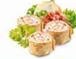
TORTILLA FLAMMKUCHEN Piccola tortilla farcita con panna, cipolle, pancetta e cavolo F -18°C, busta 1 Kg