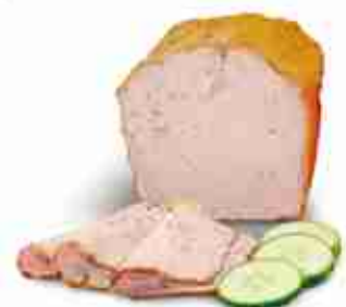
LEBERKASE Tipico polpettone tedesco A, conf. 1,5 Kg