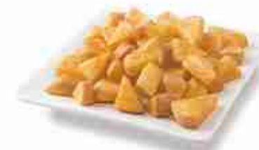
CUBI AROMATIZZATI F -18°C, conf. 2,5 Kg