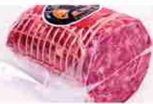
SOPRESSATA CERVO O CAPRIOLO C +0/4°C, 1,2 Kg c.ca