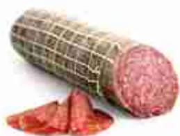
SALAME MILANESE C +0/4°C, 3 Kg