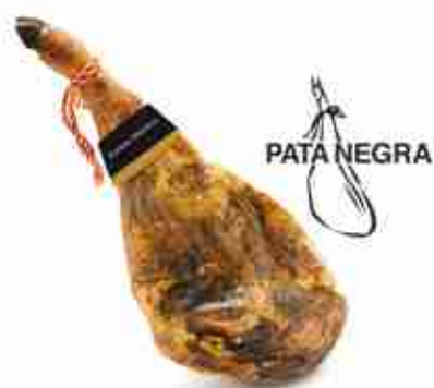
PROSCIUTTO JAMON IBERICO CON E SENZA OSSO C +0/4°C, 9 Kg c.ca