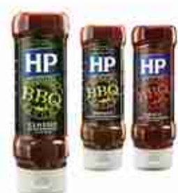
HP SALSE PER IL BARBECUE Nei gusti Classic, Honey, Spicy A, conf. 465 ml