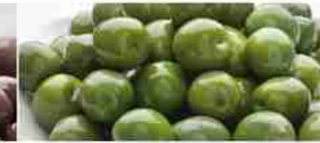
OLIVE VERDI IN SALAMOIA 000 C +0/4°C, secchiello 1/5 Kg