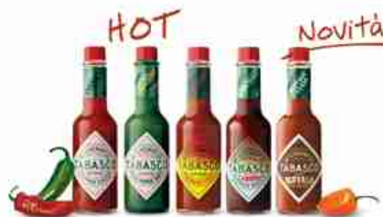
MC ILHENNY CO. TABASCO Nei gusti Classic, Green, Habanero, Chipotle, Buffalo A, grande 380 ml A, piccola 60 ml