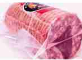
DELIZIA DI CERVO C +0/4°C, 1,2 Kg c.ca