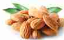
MANDORLE Assortimento di mandorle: a fette, intere o sgusciate A, conf. 1 Kg