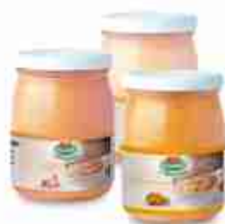
CREMA DI SALMONE, DI SCAMPI O GAMBERETTI A, vetro 580 g