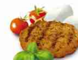
"IL BUFALOTTO" Con carne di bufalo ripieno di mozzarella di bufala F -18°C, 200 g x 20 pz