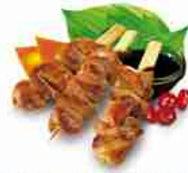
CHIK'N TERIYAKI STICK Petto di pollo marinato su spiedino di bambù con salsa di soia e zenzero F -18°C, busta 1 Kg