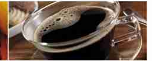
ORZO IN CIALDA A, box 30 cialde