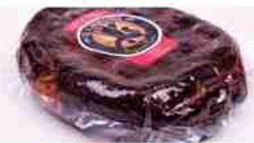
SPECK DI CINGHIALE C +0/4°C, 1,2 Kg c.ca