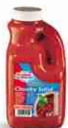
SALOMON CHUNKY SALSALSA Autentica salsa messicana con pomodoro e peperoni freschi A, conf. 2,100 Kg