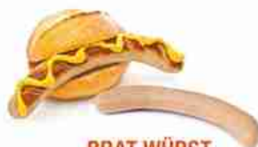
BRAT WÜRST Würstel bianco da 100 g, per la piastra C +0/4°C, 3 pz x busta x 10 buste ct.