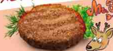
HASTERIX MR.FOODY Hamburger di cervo aromatizzato ai mirtilli F -18°C, 250 g c.ca x 15 pz