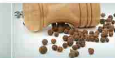
PEPE VERDE E ROSA IN SALAMOIA A, conf. 500 g