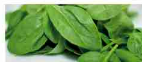
SPINACI IN FOGLIE E A CUBETTI F -18°C