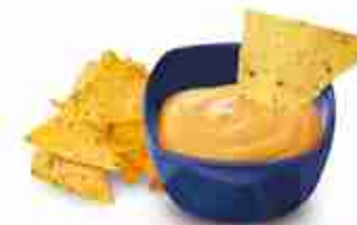
CHEDDAR CHEESE Salsa a base di formaggio Cheddar invecchiato A, conf. 2,72 Kg