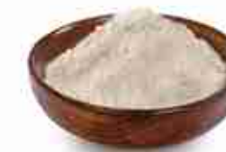
VIANDER LIEVITO IN POLVERE A, conf. 500 g