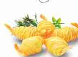
POTATO SHRIMP Gamberi avvolti in fili di patate F -18°C, vaschette 10 pz x 30 gr