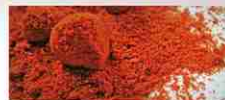
PAPRIKA DOLCE O PICCANTE A, buste 1 Kg

*Richiedi la lista completa delle spezie