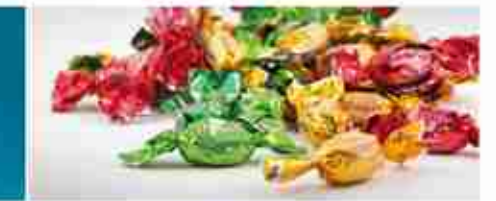
AMBROSOLI CARMELLE CORTESIA A, buste 2 Kg