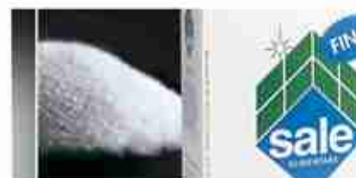
SALE FINO 1 KG A, conf. 1 Kg