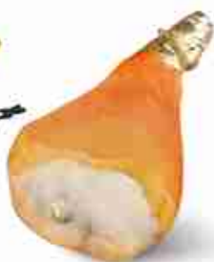
PARMA O SAN DANIELE CON OSSO Prosciutto crudo intero con osso C +0/4°C, 9/10 Kg c.ca