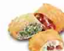
TRIS DI CALZONCELLI F -18°C, buste 2,5 Kg