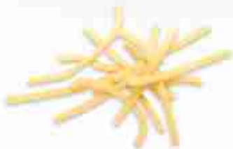
SCIALATELLI A, conf. 500 g