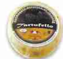
TARTUFELLO C +0/4°C, conf. 400 g