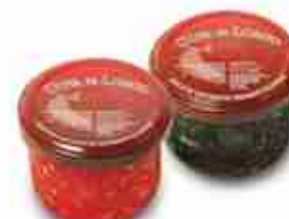
UOVA DI LOMPO ROSSE O NERE C +0/4°C, vetro 100 g