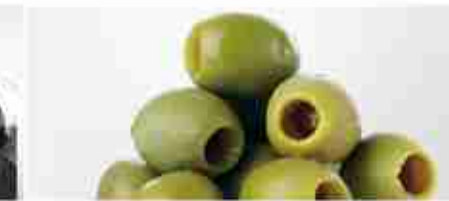
OLIVE VERDI DENOCCIOLATE A, busta 1 Kg