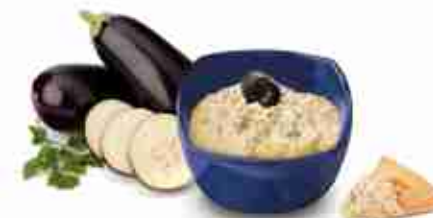
MELITZANO Salsa a base di purea di melanzane C +0/4°C, conf. 2 Kg