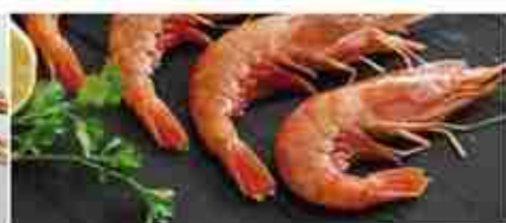
GAMBERI ARGENTINA L1 - L2 F -18°C