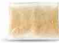
MIX GRATTUGIATO C +0/4°C, conf. 1 Kg