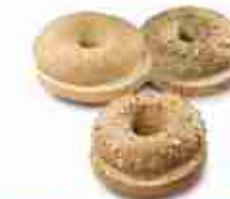
MIX BAGEL TAGLIATI Cinque diverse varietà di bagel: Papavero, Sesamo, Cipolla, Aglio, Cereali. F -18°C, conf. 40 pz 75 g cad.