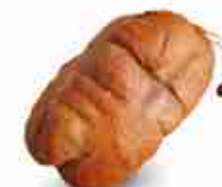
'NDUJA CALABRESE C +0/4°C, 1 Kg c.ca