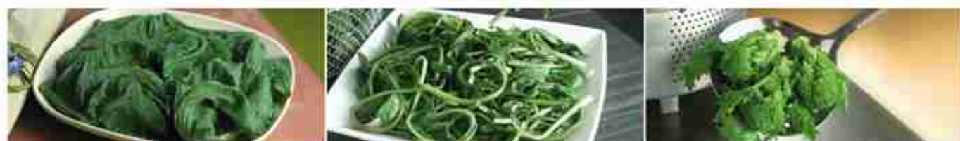
BORRAGINE IN FOGLIE F -18°C, conf. 1,2 Kg