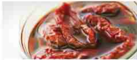
POMODORI SECCHI A, vetro 3,100 Kg