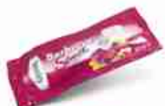
DEVELEY BBQ MONODOSE Salsa barbecue monoporzione A, conf. 20 ml