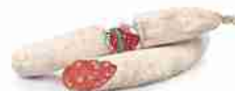
SPIANATA ROMANA C +0/4°C, 2 Kg