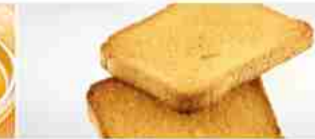
FETTE BISCOTTATE MONOPORZIONE A, 280 buste x 15 g