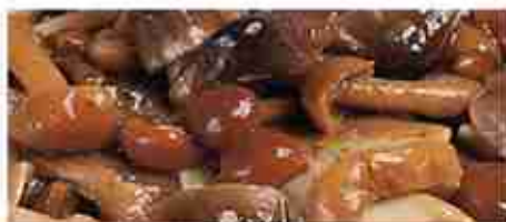
MISTO FUNGHI DI BOSCO A, vetro 3,100 Kg