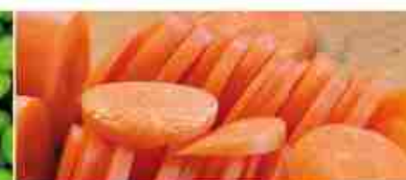
CAROTE A RONDELLE F -18°C