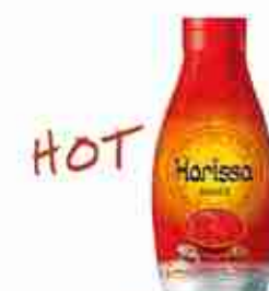
GAIA SALSA HARISSA A, conf. 900 g