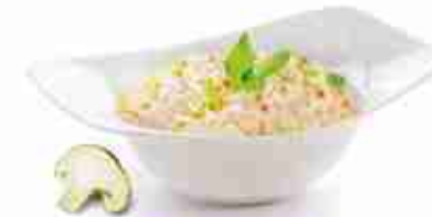
CARNAROLI Riso ideale per risotti A, crudo, 12 x 1 Kg