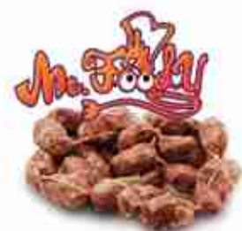
MR.FOODY SALAMINI "SIENA" C +0/4°C, 1 Kg c.ca