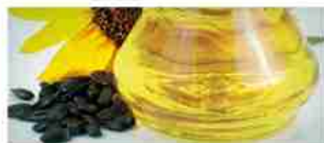
OLIO DI SEMI DI GIRASOLE A, PET 5 Lt