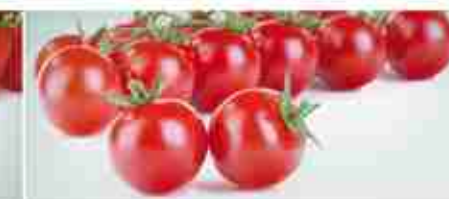
POMODORINI DI COLLINA A, latta 12 pz x 500 g / 6 pz x 3 Kg