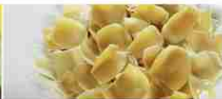
FOGLIE DI CARCIOFO A, vetro 3,100 Kg