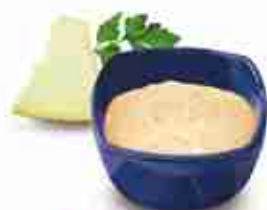
CAESAR DRESSING Salsa a base di parmigiano ideale per Caesar Salad A, conf. 3,78 Lt