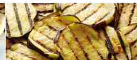
MELANZANE GRIGLIATE F -18°C