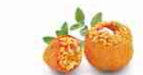
SUPPLÌ ALLA SICILIANA F -18°C, 130 g buste 2,5 kg