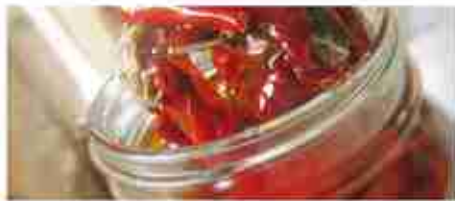
PEPERONI A FILETTI A, vetro 3,100 Kg