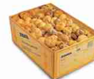
MIX MINI ROSETTE Quattro varietà di rosette: Semplici, ai Semi di papavero, ai Semi di sesamo, ai 3 cereali. Ideale per hotel e catering F -18°C, conf. 120 pz 35 g cad.