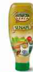
GAIA SENAPE A, conf. 900 ml