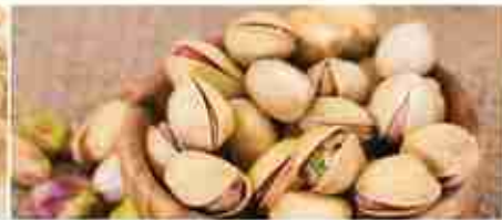
PISTACCHI SALATI A, busta 1 Kg