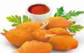
CHELE DI GRANCHIO F -18°C, conf. 1 Kg