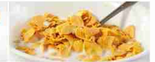
CEREALI Muesli; Corn Flakes; Choco Rice A, conf. 8 buste x 500 g