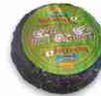
IMBARIAGOT PECORINO AFFOGATO NEL VINO ROSSO C +0/4°C, 1,5 Kg c.ca