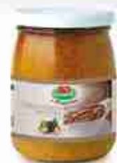
CREMA DI PORCINI TARTUFATA A, vetro 580 g