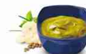
SENAPE La classica A, bustine, squeezer e secchielli