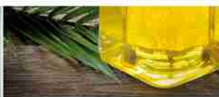
OLIO DI PALMA BIFRAZIONATO A, conf. 25 Lt