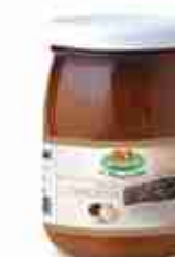
SALSA TARTUFATA A, vetro 580 g