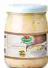
CREMA DI CECI A, vetro 580 g