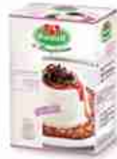
VIANDER PANNA COTTA Preparato subito pronto A, conf. 8 buste 140 g x 96 porz.