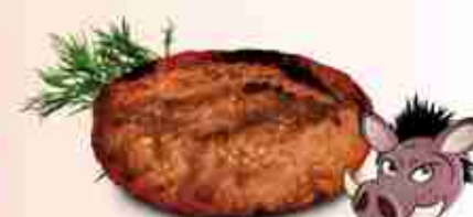
CINGHIALIX Hamburger di cinghiale F -18°C, 200 g c.ca x 20 pz