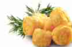
CHEDDAR NUGGETS F -18°C, conf. 1 Kg