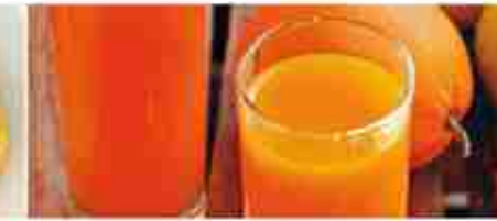
SUCCO CONCENTRATO Arancia; Arancia Rossa; Pompelmo; Ananas; ACE A, tanica 7 Kg