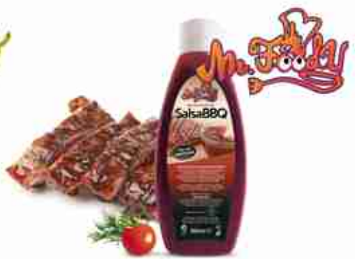
MR.FOODY SALSA BBQ Gusto "smokey" per un barbecue DOC! A, conf. 1 Lt