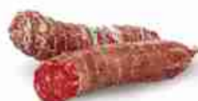
VENTRICINA CALABRESE C +0/4°C, 2,5 Kg