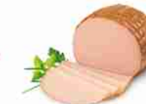
FESA DI TACCHINO ARROSTO C +0/4°C, conf. 5 Kg c.ca