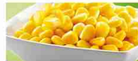
MAIS A, latta 150 g / 300 g / 3 Kg