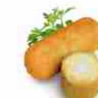
CROCCHÉ CON MOZZARELLA F -18°C, 130 g buste 2,5 kg