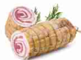
PANCETTA ARROTOLATA CLASSICA C +0/4°C, conf. 3 Kg c.ca