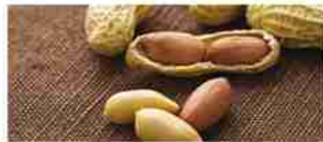
ARACHIDI TOSTATE SALATE A, busta 1 Kg