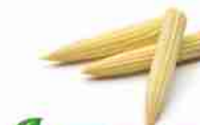
PANNOCCHIETTE IN AGRODOLCE A, vetro 330 g