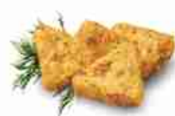
RÖSTI ALLO SPECK Triangolini di speck e patata F -18°C, conf. 2,5 Kg