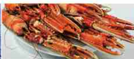
SCAMPI F -18°C