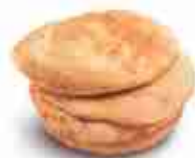
PANE PER KEBAB F -18°C, conf. 10 buste x 3 pz

Vari colori e diametri: 15/25/30, le 30 sono classiche, rosse e verdi Tortillas di mais ø 15 cm F -18°C, 18 buste x 24 pz