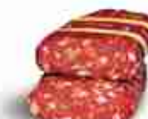
SPIANATA CALABRA C +0/4°C, 2 Kg