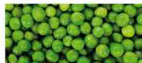
PISELLI F -18°C