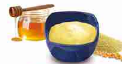
HONEY & MUSTARD Salsa a base di miele e senape, ideale su pollo, sandwich e insalate A, conf. 2,4 Lt