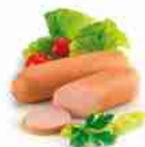
KNACKER WÜRST A, vetro 5 pz 310 g