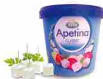
FORMAGGIO TIPO FETA Formaggio a cubetti C +0/4°C, conf. 1 Kg