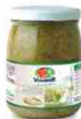
PESTO DI PISTACCHIO A, vetro 580 g