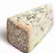
GORGONZOLA C +0/4°C