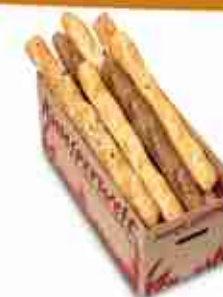
MIX BAGUETTE Quattro varietà di baguette: Croccanti, alla Cipolla, Finlandesi, alle Olive F -18°C, conf. 120 pz 280 g cad.