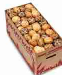
MIX "BUONGUSTAIO" Quattro varietà di panini: Panini con semi di zucca, Rosette al naturale, Rosette con semi di papavero, Mini ciabatte alle olive. Ideale per hotel e catering F -18°C, conf. 120 pz 37,5 g cad.