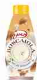
GAIA SALSA BOSCAIOLA A, conf. da 830 g