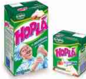
PANNA HOPLA Preparato per dolci A, conf. 500 g / 1 Kg