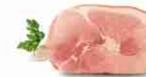
PROSCIUTTO COTTO C +0/4°C, 7 Kg c.ca