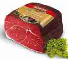
FIOCCO DELLA FORESTA NERA Tipico prosciutto crudo affumicato C +0/4°C, conf. 2.5 Kg c.ca