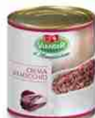
CREMA DI RADICCHIO A, latta 1 Kg