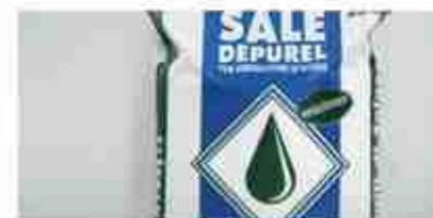
SALE PER ADDOLCITORE A, conf. 25 Kg