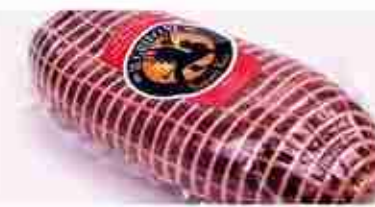
PROSCIUTTO DI CAPRIOLO C +0/4°C, 700 g/1,7 Kg c.ca