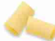
PACCHERI A, conf. 500 g