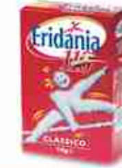
ERIDANIA ZUCCHERO SEMOLATO A, 10 astucci x 1 Kg