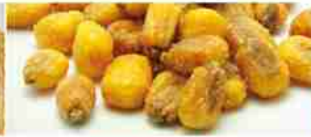
MAIS GIGANTE TOSTATO A, busta 500 g / 2 Kg