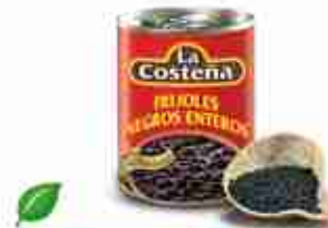
LA COSTEÑA FAGIOLI WHOLE BLACK MEXICAN Fagioli neri interi A, conf. 560 g