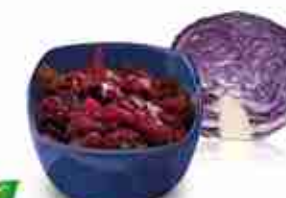
CRAUTI ROSSI A, vetro 650 g