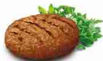
HAMBURGER BUFALO Hamburger di bufala F -18°C, 200 g x 20 pz