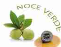
NOCE VERDE ALLO SCIROPPO Gusta i formaggi con le prelibate Noci Verdi A, conf. 300 g

Sapori intensi per piatti dal gusto deciso.