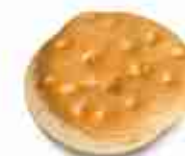
FOCACCIA FRANCESE F -18°C, conf. 48 pz 100 g cad.