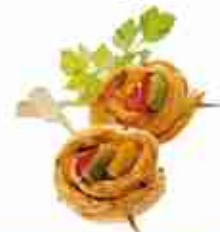
CHIK'N SWEET PEPPER STICK Petto di pollo marinato ripieno di peperoni, su spiedino di bambù gusto dolce-piccante F -18°C, busta 1 Kg