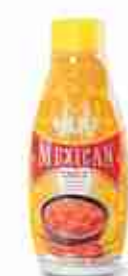
GAIA SALSA MESSICANA A, conf. 900 g