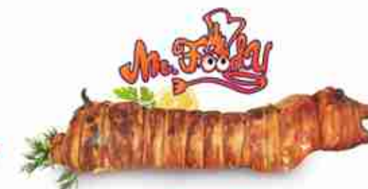
MR.FOODY PORCHETTA DI ARICCIA C +0/4°C, tronchetto 3/5 Kg c.ca intera 13/15 Kg c.ca