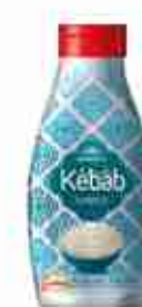
GAIA SALSA KEBAB A, conf. 900 g