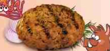
HOBELIX MR.FOODY Hamburger di cinghiale aromatizzato F -18°C, 250 g c.ca x 15 pz