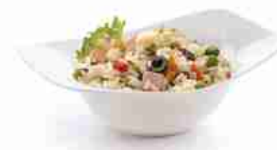
RIBE PARBOILED Ideale per insalate di riso A, crudo, 12 x 1 Kg 1 x 5 Kg