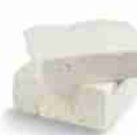
FETA IN VASCHETTA C +0/4°C, conf. 4 Kg