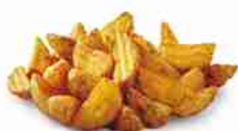
PATATE A SPICCHI GUSTO BBQ F -18°C, conf. 1 Kg