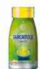
GAIA SALSA GUACAMOLE Salsa di avocado A, conf. 270 g