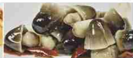
FUNGHI DI MUSCHIO A, vetro 3,100 Kg