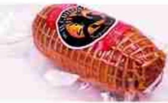
PETTO D'ANATRA ROLLE C +0/4°C, 800 g c.ca