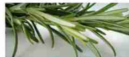
ROSMARINO SECCO A, buste 1 Kg