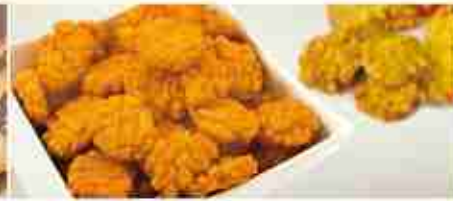
CRACKERS DI RISO PICCANTI A, busta 500 g