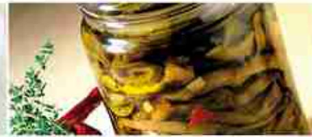
MELANZANE A FILETTI A, vetro 3,100 Kg