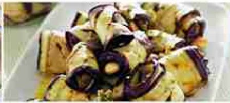
MELANZANE A FETTE GRIGLIATE C +0/4°C, vaschetta 1 Kg