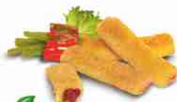
FAGOTTINI DI RÖSTI Rösti ai frutti di bosco F -18°C, conf. 3 Kg