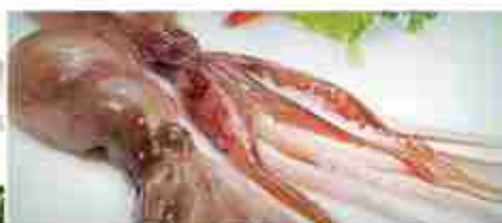
POLPI VARIE TAGLIE F -18°C