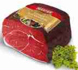
FIOTTO DELLA FORESTA NERA Squisito prosciutto crudo affumicato C +0/4°C, conf. 2,5 Kg