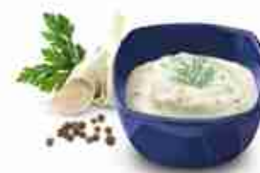
RANCH DRESSING Salsa a base di panna acida, piccante e speziata A, conf. 3,78 Lt