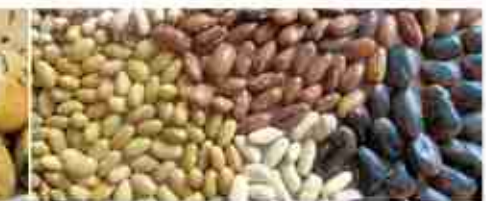
FAGIOLI Red Kidney, Borlotti, Cannellini A, latta 3 Kg Borlotti, Cannellini A, vetro 360 g