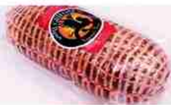
PROSCIUTTO DI AGNELLO C +0/4°C, 1,2 Kg c.ca