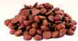
GOCCE DI CIOCCOLATO Gocce di cioccolato per decorazioni dolci A