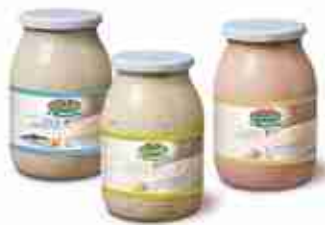
VIANDER SALSE Tartara, Cocktail, Tonnata A, 900 g