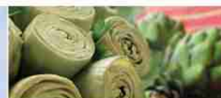
CUORI DI CARCIOFI F -18°C