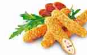
MOZZARELLA DIAVOLA Bastoncini di mozzarella e pezzetti di salamino piccante F -18°C, busta 1 Kg