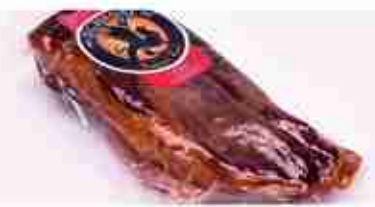
SPECK DI ANATRA AFFUMICATO C +0/4°C, 600 g c.ca