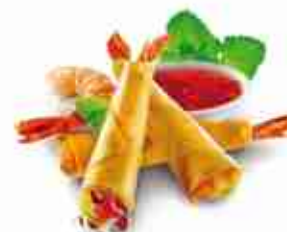
SHANDONG SHRIMP ROLL Deliziosi gamberi in pasta fillo F -18°C, conf. 1,5 Kg