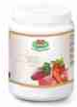
VIANDER FONDO BRUNO A, barattolo 600 g