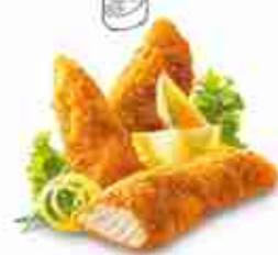
CRISPY CHIK'N FINGERS Filetti di pollo, teneri e succosi, coperti da panatura croccante F -18°C, busta 1 Kg