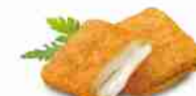
MOZZARELLA IN CARROZZA PREFRITTA F -18°C, buste 2,5 Kg