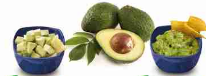
AVOCADO A CUBETTI F -18°C, conf. 500 g