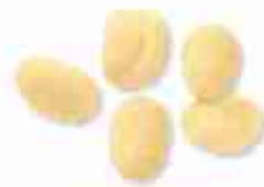
GNOCCHI A, conf. 1 Kg