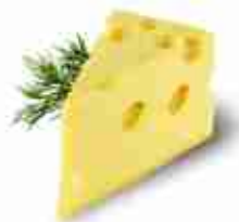
EMMENTAL C +0/4°C, blocco 2 Kg c.ca