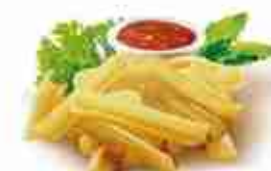
PATATE FRY'N DIP F -18°C, conf. 2,5 Kg