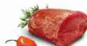
CARPACCIO DI MANZO C +0/4°C, conf. 2,5 Kg