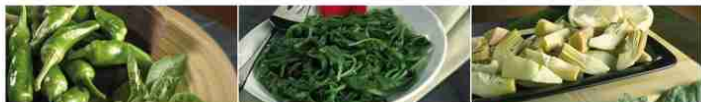
PEPERONE FRIGGITELLO F -18°C, conf. 3 Kg