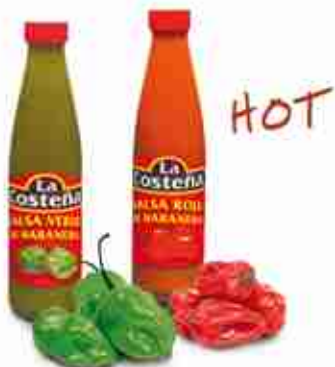
LA COSTEÑA SALSE Salse di peperoncino habanero verde o rosso A, 125 ml