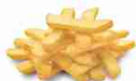
MYDIBEL STEAKHOUSE 10/20 F -18°C, conf. 2,5 Kg