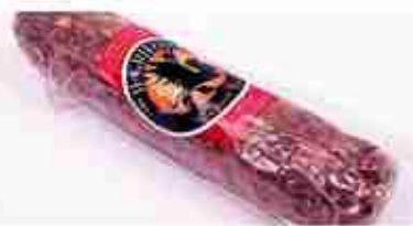
SALAME DI CAPRIOLO C +0/4°C, 500 g c.ca