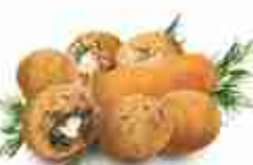
COCKTAIL MICRO F -18°C, buste 2,5 Kg