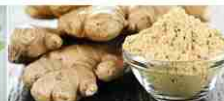
ZENZERO MACINATO A, formato Pet