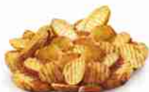
PATATE CRINKLE A FETTE SPEZIATE F -18°C, conf. 1 Kg