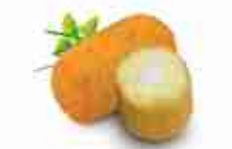
CROCCHÉ DI PATATE MIGNON F -18°C, buste 2,5 Kg