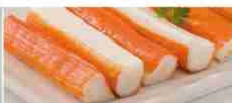
BASTONCINI DI SURIMI F -18°C