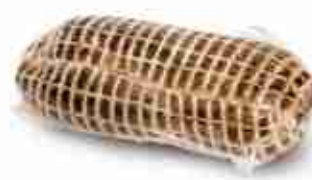
PROSCIUTTO DI CAPRIOLO SOTTOVUOTO C +0/4°C, 2 Kg c.ca