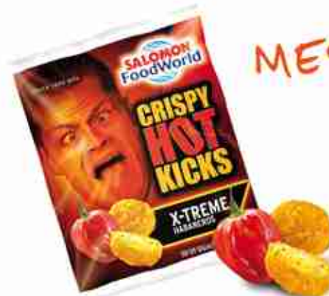
CRISPY HOT KICKS "X-TREME" - HABANEROS Crocchette di formaggio e pezzetti di peperoncino Habanero, SUPER PICCANTI! F -18°C, conf. 1 Kg