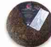
PEPITO PECORINO AFFINATO AL PEPE C +0/4°C, 1 Kg c.ca