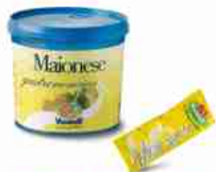
VIANDER MAIONESE SECCHIELLO E BUSTINE A, secchiello 5 Kg; bustine 250 pz