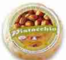
PISTACCHIO C +0/4°C, conf. 400 g