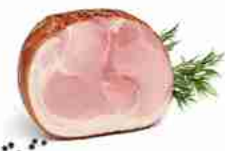
PROSCIUTTO DI PRAGA C +0/4°C, 7 Kg c.ca