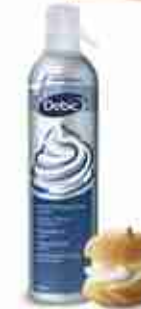
DEBIC PANNA SPRAY F -18°C, conf. 700 ml