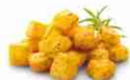
PATATE DICE 20/20 Rissoles alle erbe F -18°C, conf. 2,5 Kg