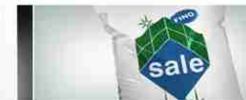
SALE FINO 25 KG A, conf. 25 Kg