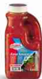
SALOMON ASIA SAUCE L'originale salsa agrodolce ideale su gamberi e crostacei A, conf. 2,4Kg