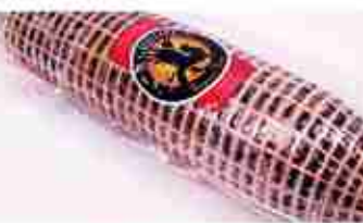
PROSCIUTTINO D'OCA C +0/4°C, 400 g c.ca