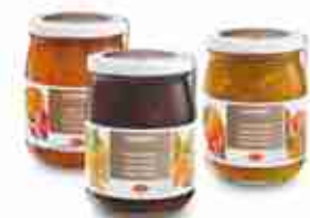
WIBERG CHUTNEY Nei gusti: uva-arancia; arancia-mango; zucca-mela A, conf. 500 g