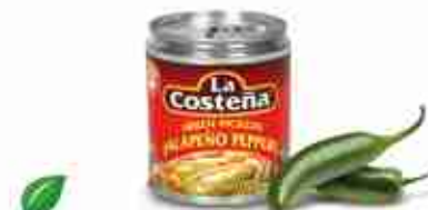
LA COSTEÑA JALAPEÑO GREEN PICKLED Peperoncini jalapeño interi A, conf. 3 / 1 kg