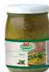
PESTO A, vetro 580 g latta 1 Kg