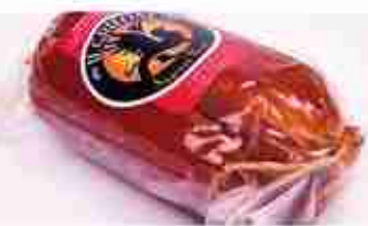
PETTO D'OCA AFFUMICATO C +0/4°C, 700 g c.ca