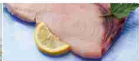
PESCE SPADA A FETTE F -18°C