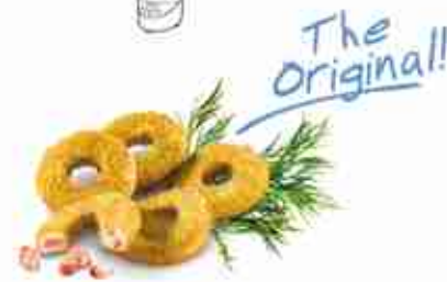
DONUTS CHIK'N BACON Anelli di pollo e bacon fritti F -18°C, busta 1 Kg