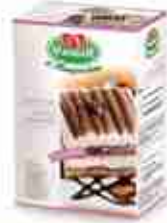
VIANDER TIRAMISÙ Preparato subito pronto A, conf. 4 buste 270 g x 80 porz.