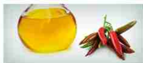
OLIO AL PEPERONCINO A, conf. 250 ml