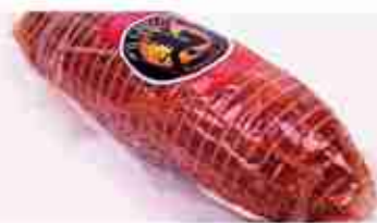
PROSCIUTTO CINGHIALE C +0/4°C, 900 g c.ca