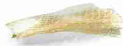
COLLA DI PESCE In fogli per guarnizioni A, conf. 1 Kg