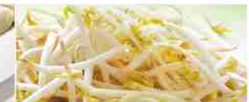
GERMOGLI DI SOIA A, vetro 330 g