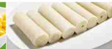
CUORI DI PALMA A, latta 1 Kg