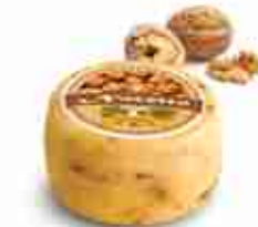
NOCETTO C +0/4°C, conf. 400 g