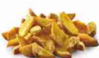
PATATE A SPICCHI SALE E PEPE F -18°C, conf. 1 Kg