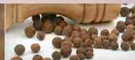
PEPE NERO O BIANCO INTERO O MACINATO A, buste 1 Kg