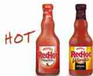
FRANK'S RED HOT ORIGINAL al peperoncino di cayenna HOT BUFFALO ideale per alette "Buffalo" A, 200 ml