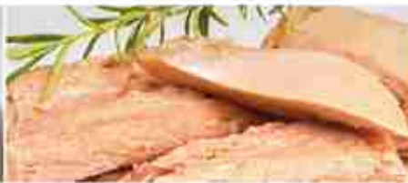
TONNO TRANCI A, latta 1,730 Kg / busta 1 Kg FILETTI A, vetro 500 g