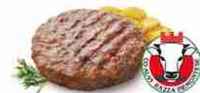
HAMBURGER SAVOY Fassona Piemontese IGP 100% carne pregiata italiana F -18°C, 250 g c.ca x 20 pz