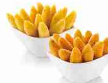
TAPAS LATINO TAPAS SIRTAKI E BASILICO F -18°C, conf. 1 Kg