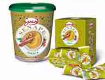
GAIA SENAPE SECCHIELLO E BUSTINE A, secchiello 5 Kg; bustine 102 pz