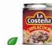
LA COSTEÑA CUITLACOCHÉ Fungo del mais A, conf. 320 g