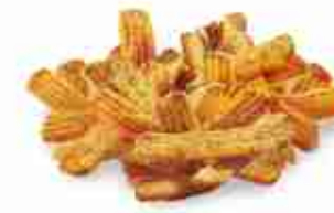
PATATE DIPPING STRIPES Con sale pepe e cipolla F -18°C, conf. 2,5 Kg