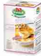
VIANDER CREMA CATALANA Preparato subito pronto A, conf. 5 buste 200 g x 60 porz.