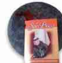
IL SAMBUCCO FORMAGGIO DI PECORA STAGIONATO C +0/4°C, 1,5 Kg c.ca