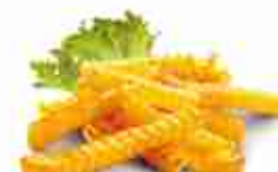
PATATE CRISS CUT 9-9 Patate ondulate prefritte F -18°C, conf. 2,5 Kg