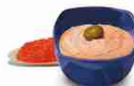
TAMOSALATA Salsa a base di uova di pesce salate C +0/4°C, conf. 3 Kg