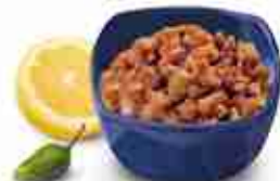
MIX BEEF TOPPING Carne di manzo tritata piccante con lime e peperoncino F -18°C, conf. 1 Kg