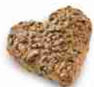
PANINO "WAKE UP" A FORMA DI CUORE Con uva passa e cereali F -18°C, 60 g x 50 pz