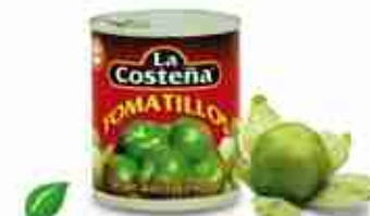
LA COSTEÑA TOMATILLOS Salsa di pomodoro verde A, conf. 250 g - 3 / 1 kg