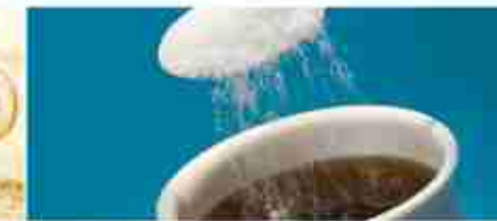
DOLCIFICANTI MONODOSE Zucchero di canna, box 1 Kg; Edulcorante box 300 g; Zucchero in bustine cart. 10 Kg; Miele in bustine conf. 1,2 Kg; Fruttosio conf. 1 Kg; Dieter A