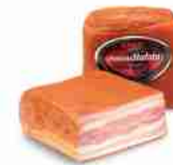
PANCETTA COTTA DOPPIA STUFATA C +0/4°C, conf. 4,5 Kg c.ca