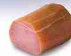
TRANCIO DI MARLIN C +0/4°C, 1 Kg c.ca