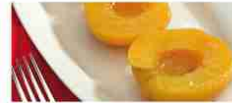
FRUTTA SCIROPATA Ananas; Albicocche; Pesche; Macedonia A, conf. 3 Kg