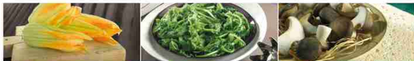
FIORI DI ZUCCA AL NATURALE F -18°C, conf. 2 Kg