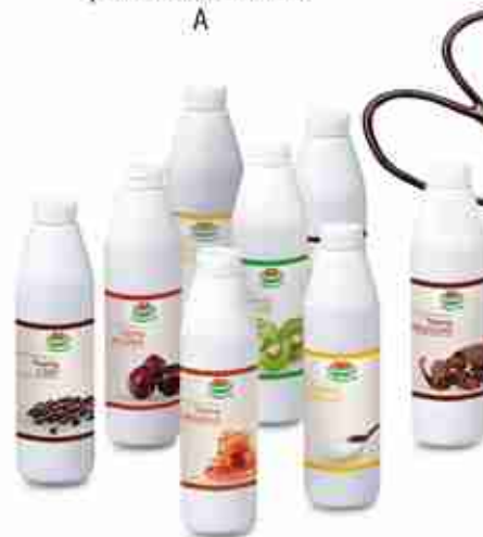
DESSERT TOPPING Assortimento topping vari gusti: Caffè; Caramello; Cioccolato; Ciliegia; Kiwi; Zabaione; Mou; Glanduella A