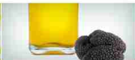
OLIO AL TARTUFO A, conf. 250 ml