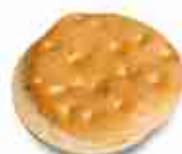
FOCACCIA FRANCESE F -18°C, conf. 48 pz 100 g cad.