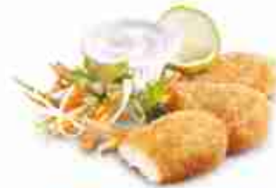
MINI SCHNITZEL Tenere cotolette di maiale preparate con panatura dorata e una leggera nota di limone F -18°C, busta 1 Kg