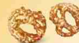
MINI BRETZEL AL FORMAGGIO F -18°C, Cod. 404 - 36 x 70 g F -18°C, Cod. 437 - 60 pz x 45 g