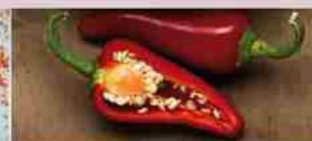
PEPERONCINO FRANTO A, buste 1 Kg