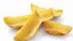
PATATE DIPPERS F -18°C, conf. 2,5 Kg