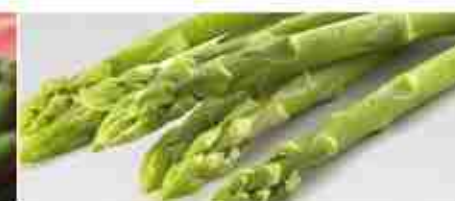
ASPARAGI F -18°C, conf. 1 Kg