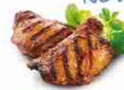
FIRE ROASTED CHICKEN RIBS Coscia di pollo con osso senza pelle, marinata ed arrostita F -18°C, busta 1 Kg