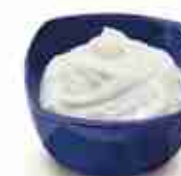
YOGURT GRECO C +0/4°C, conf. 5 Kg