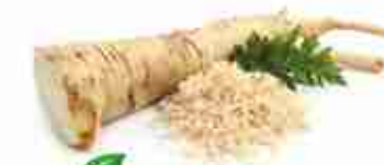
RAFANO BIANCO A, vetro 145 g