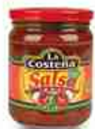
LA COSTEÑA Salsa DIP Ideale per tortillas chip A, 435 g