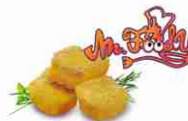
BOCCONCINI DI BACCALÀ Gustoso baccalà pastellato F -18°C, buste 2,5 Kg