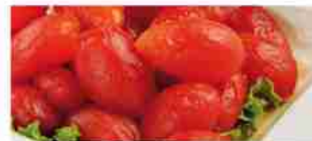
POMODORI PELATI A, latta 6 pz x 3 Kg