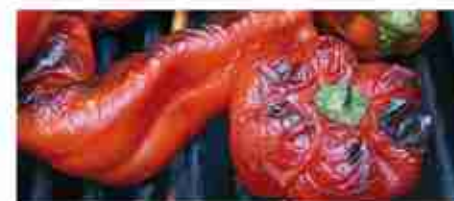
PEPERONI GRIGLIATI F -18°C