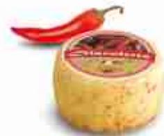
DIAVOLETTO Formaggio aromatizzato al peperoncino C +0/4°C, conf. 400 g