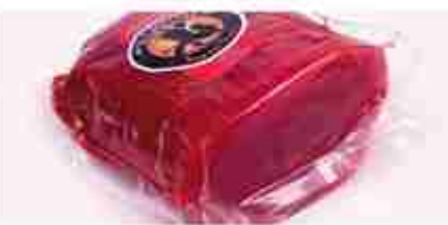
CARPACCI Manzo, Cervo, Lonza di maiale C +0/4°C, 900 g/1,5 Kg c.ca