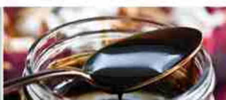
GLASSA ACETO BALSAMICO A, conf. 500 ml