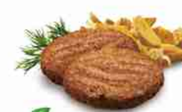
VEGETARIANO Dalla proteina del grano (seitan) l'hamburger "light" F -18°C, 100 g x 24 pz