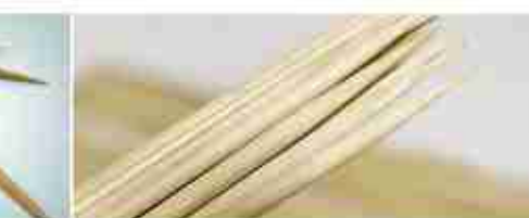
SPIEDINI IN BAMBOO