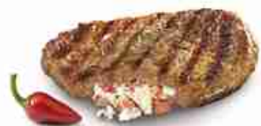
BURGER CHEESE & TOMATO Hamburger ripieno di formaggio feta e pomodori F -18°C, 300 g x 20 pz