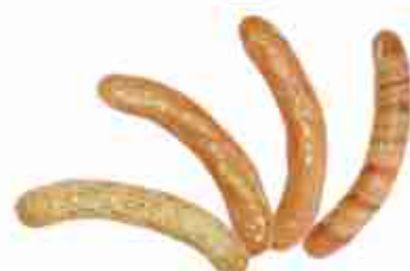
POKER WÜRSTEL 1 Bratwürst rucola e formaggio; 1 Bockwürst con tocchetti di speck; 1 Würstel ripieno di formaggio; 1 Würstel con pancetta A, busta 450 g c.ca