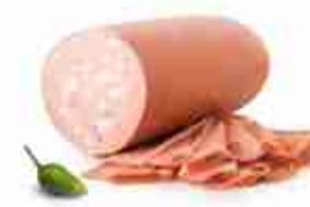
MORTADELLA Mortadella 15 cm C +0/4°C, 2,5 Kg c.ca