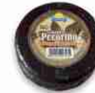
PECORINO STAGIONATO SOTTO FOGLIE DI NOCI C +0/4°C, 1,5 Kg c.ca