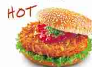
CRUNCHY CHIK'N BURGER Hamburger di pollo croccante CLASSIC - F -18°C, 92 g x 17 pz x 1,5 Kg busta XL - F -18°C, 200 g x 30 pz cart.