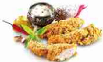
CHIK'N FINGERS TIKKA Filetto di pollo in croccante panatura indiana "Tikka" F -18°C, busta 1 Kg