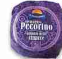
PECORINO AFFINATO NELLE VINACCE C +0/4°C, 1,5 Kg c.ca