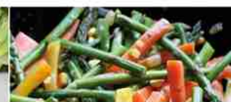
VERDURE PER WOK F -18°C