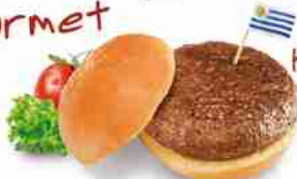
IBERO GAUCHO Hamburger di manzo uruguayano piccante F -18°C, 200 g x 20 pz