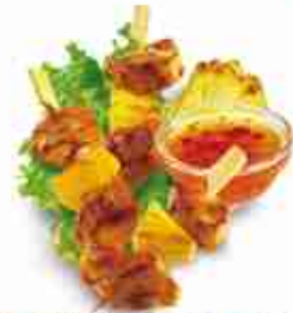
CHIK'N PINEAPPLE STICK Petto di pollo marinato su spiedini di bambù con pezzetti di ananas F -18°C, busta 1 Kg