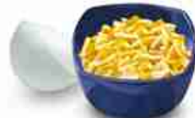
MIX RED & WHITE Miscela di formaggio Edamer e Cheddar a filetti C +0/4°C, conf. 2 Kg