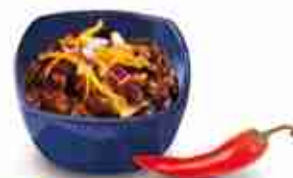
CHILI CON CARNE Piatto formato da carne, fagioli rossi, peperoni, cipolla e salsa di pomodoro F -18°C, conf. 1 kg