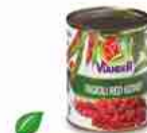
VIANDER FAGIOLI RED KIDNEY Fagioli rossi al naturale A, conf. 3 / 1 kg