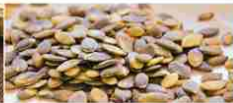
SEMI DI ZUCCA TOSTATI A, busta 1 Kg