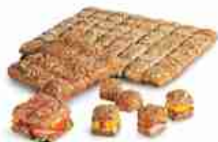
ASSORTIMENTO PAN CARRE In 4 varietà, da farcire F -18°C, 840 g x 4 pz