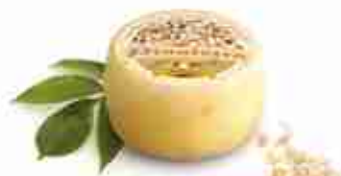
PINOLETTO Formaggio aromatizzato con pinoli, pistacchi e noci C +0/4°C, conf. 400 g