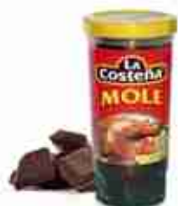
LA COSTEÑA MOLE POBLANO A base di cioccolato e chili A, 200 ml