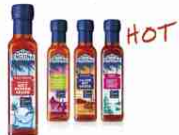
ENCONA SALSE PICCANTI Nei gusti Cajun, Hot Pepper, Jamaican, Peri-peri, Sweet Mango A, conf. 200 ml