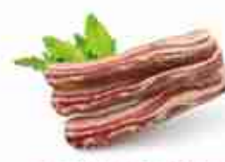
BACON-PANCETTA AFFUMICATA C +0/4°C, conf. 3 Kg c.ca SURGELATA F -18°C, vaschetta 1,4 Kg