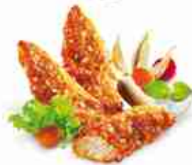
CHIK'N FINGERS COCONUT Filetti di pollo in croccante panatura e fiocchi di cocco F -18°C, busta 1 Kg