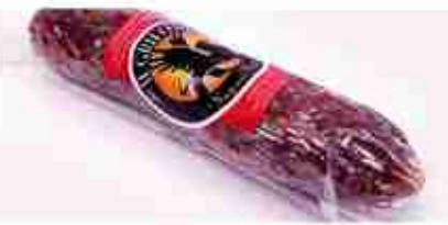
SALAME DI CERVO C +0/4°C, 500 g c.ca